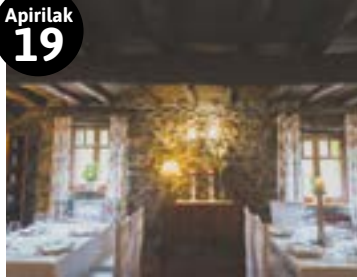
Bazkaria Belaustegi jatetxean