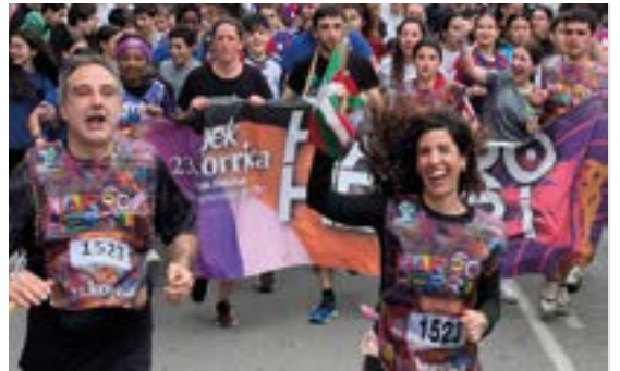
ALDATZE ESKOLAKO GURASO ELKARTEA