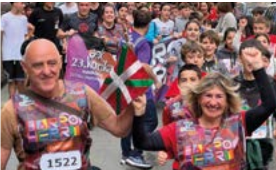
J.A. MOGEL IKASTOLA