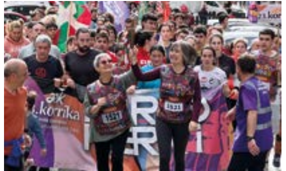
ARRATE KULTUR ELKARTEA