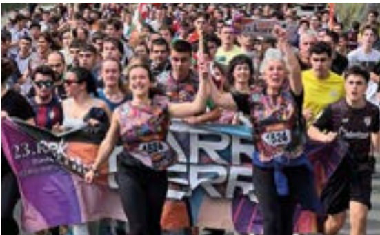
LEGARREKO JAI BATZORDEA