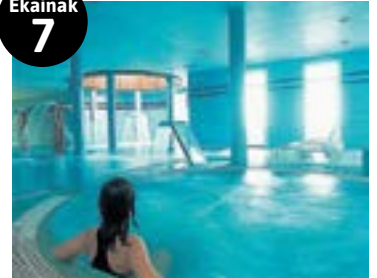
Opari-bonua Hotel Talasoterapia Zelaian

aspiradora (Wifi konexioarekin). Eta hilabetea amaitzeko, maiatzaren 31n , Txurruka jatetxean bi laguntzako bazkari ederra zozketatuko da.