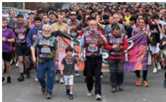
AMAÑA JAI BATZORDEA