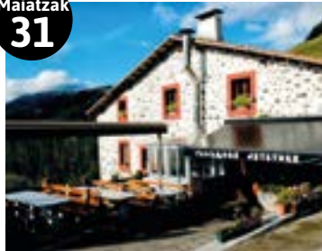
Bazkaria Txurruka jatetxean