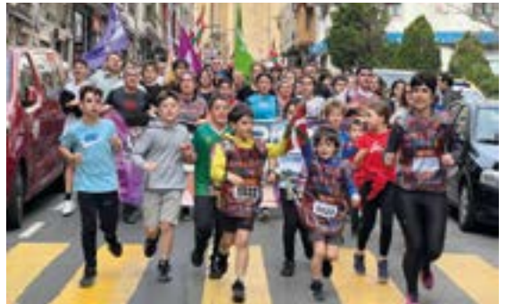
J.A. MOGEL IKASTOLAKO GURASO ELKARTEA