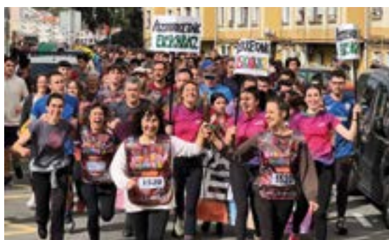
UEU-UDAKO EUSKAL UNIBERTSITATEA