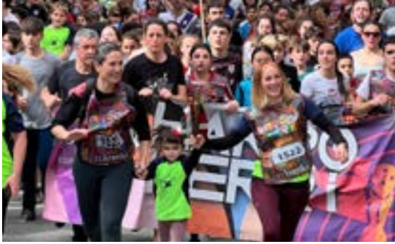
SAN ANDRES ESKOLAKO GURASO ELKARTEA