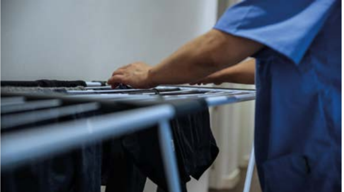
Atzerriko jatorria duten emakumeak izaten dira zaintza eta etxez etxeko lanetan aritzen diren gehienak.

kontuk hemen nola funtzionatzen duten ezagutzeko aukera izan ez dutelako, ezjakintasuna dute hainbat gauzen inguruan eta abusu egoerak bizi dituzte: ez zaie behar dena ordaintzen, ez dira lan-baldintzak betetzen, edo dena delakoa.