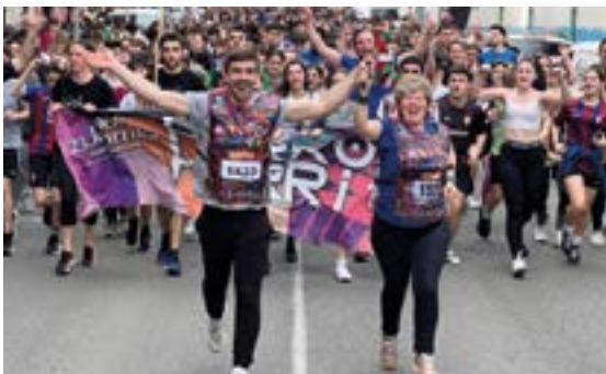
ALDATZE ESKOLAKO IRAKASLEAK