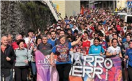
JOSU EGIGURENEN LAGUNAK