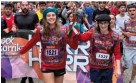
EIBAR RUGBY TALDEA