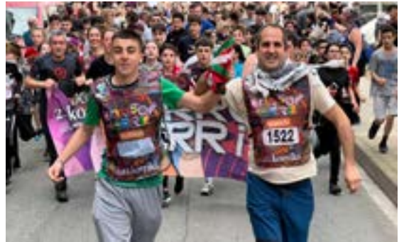
...ETA KITTO! EUSKARA ELKARTEA