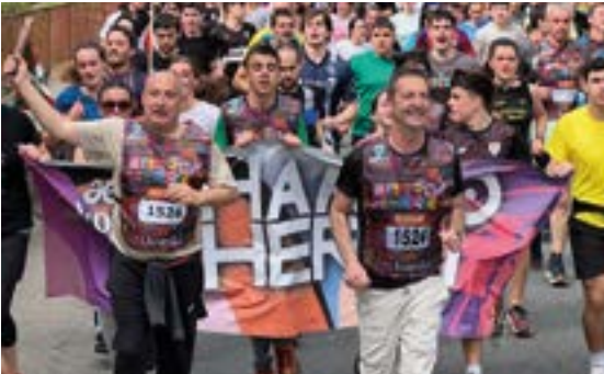
EIBARKO BASO BIZIAK