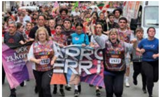
SAN ANDRES ESKOLA