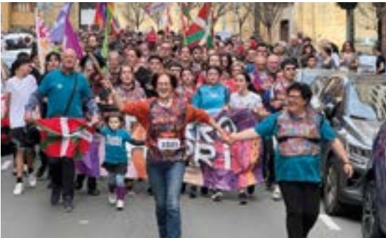
GURE ESKU DAGO