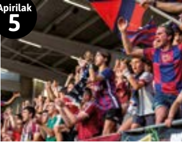
Eibar FTren partidua ikusteko 2 sarrera