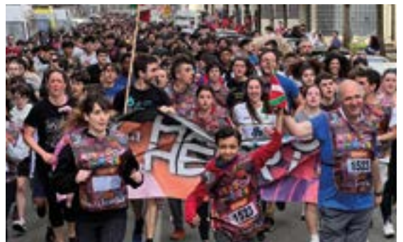
URKIZU IKASTETXEKO GURASO ELKARTEA