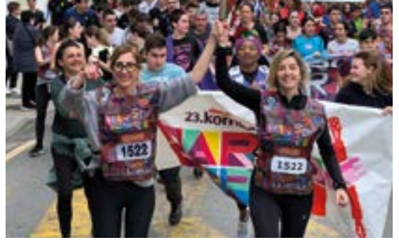
EIBAR BHI-KO GURASO ELKARTEA