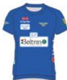
CCE Saria (Kadetek)