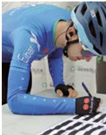
Klub Deportiboko taldeko txirrindulari bat sinatzen lasterketa bat hasi aurretik.