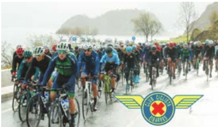
Getariako arratoiak gustora hartzen du Valenciaga Memorialarekin duen hitzordua.

Eibarko Txirrindulari Elkar-teak antolatzen duen lasterketa hau aurtengo egutegiaren hirugarrena izango da, otsailaren 25ean jokaturako junior mailako 46. Uda-berri Sariaren eta apirilaren 14an egin zen kadete mailako 7. CCE Sari Nagusiaren ondoren. Hilabe-