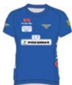
Udaberri Proba (Juniorrak)