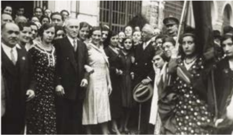
Niceto Alcala Zamora presidentea, Eibarko emakume errepublikazalez inguratuta, Armeria Eskolan (1932-9-13).

Errepublikaren eraginez, guraso batzuek ez zituzten euren umeak bataiatu eta, horregatik, ez zieten santu edo santaren izena jarri, bestelakoak baizik: Paz, Nieves, Aurora... edo lore izenak (Rosa, Jacinta..).