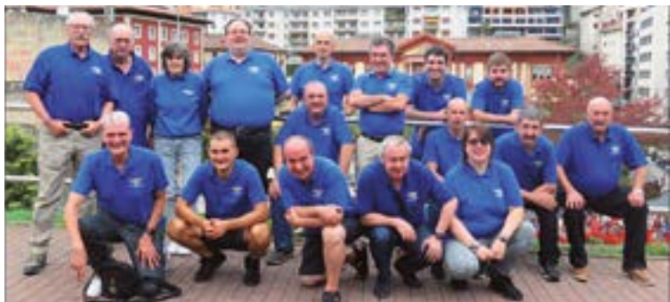
Eibarko Txirrindulari Elkarteak jakin izan du azken urteotako zailtasunei aurre egiten.