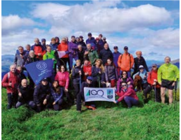
Hasierako euriak giro lasaiagoari egin zion tarte Urkora igo zutenentzako.

Euskal Mendizale Federazioaren mendeurrenaren barruko "100 urte, 100 mendi" ekintzaren barruan zegoen Urkorako igoera egiteko, 50 mendizale inguru elkartu ziren Urkizuko iturrian ibilbidea hasteko. Laster euria hasi zuen eta "baita ur dexente bota ere momentu batean". "Eskerrak txangoaren bigarren zatian eguzkia agertu zen", horrek beste kolore argitsuekin ibiltzeko aukera eskaini baitzuen Aginaga inguruetan Urkora heldu aurretik. Antolatu zen bidea ez zen betikoa izan, "mendizale gehienentzat oso ustekabe atsegina bihurtuz".