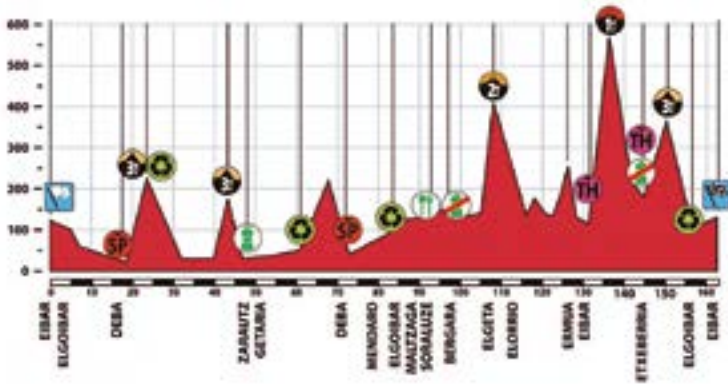
Lasterketaren perfila: Zarautzeraino joango dira eta, ondoren, Maltzagatik Bergarara.