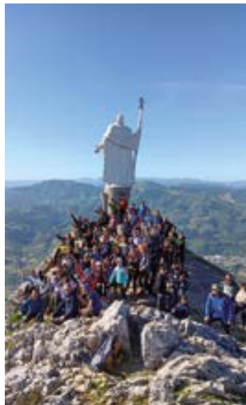
Odol gaztekoak Xoxote gainean.

Xoxotera igo zuten apirilaren 21ean Eibarko Klub Deportiboko mendi batzordekoek antolatutako umeen zazpigarren mendi irteeran. "Eguraldi paregabearekin" guztira 41 haurrez osatutako taldea bildu zen, hainbat gurasoren laguntzaz,