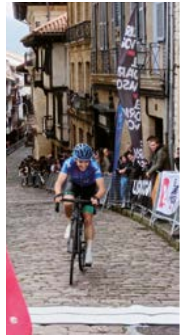
Eibarko taldeko ordezkarri bat aurreko asteburuko Bidasoako Itzulian.

Baina goi mailako txirrindularitzan eman diren aldaketek, kontrara, lasterketak gustagarriago bihurtu