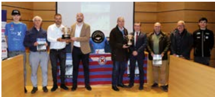
Apirilaren 23an aurkeztu zuten lasterketa Eibarko udaletxeko Pleno Aretoan.

Lasterketak sei mendate izango ditu: 3. mailako Itziar, Meagas, Areitio eta San Miguel, 2. mailako Elgeta eta 1. mailako Ixua. Horrek ibilbidea bi zatitan banatu dezake, probaren aurkezpenean adierazi zuten bezala: “Lehenengoko erdian probak dituen gorabeherak azkar joatea ekarriko du, eta bigarrenaren eskalatzaileek izango dute zeresana,