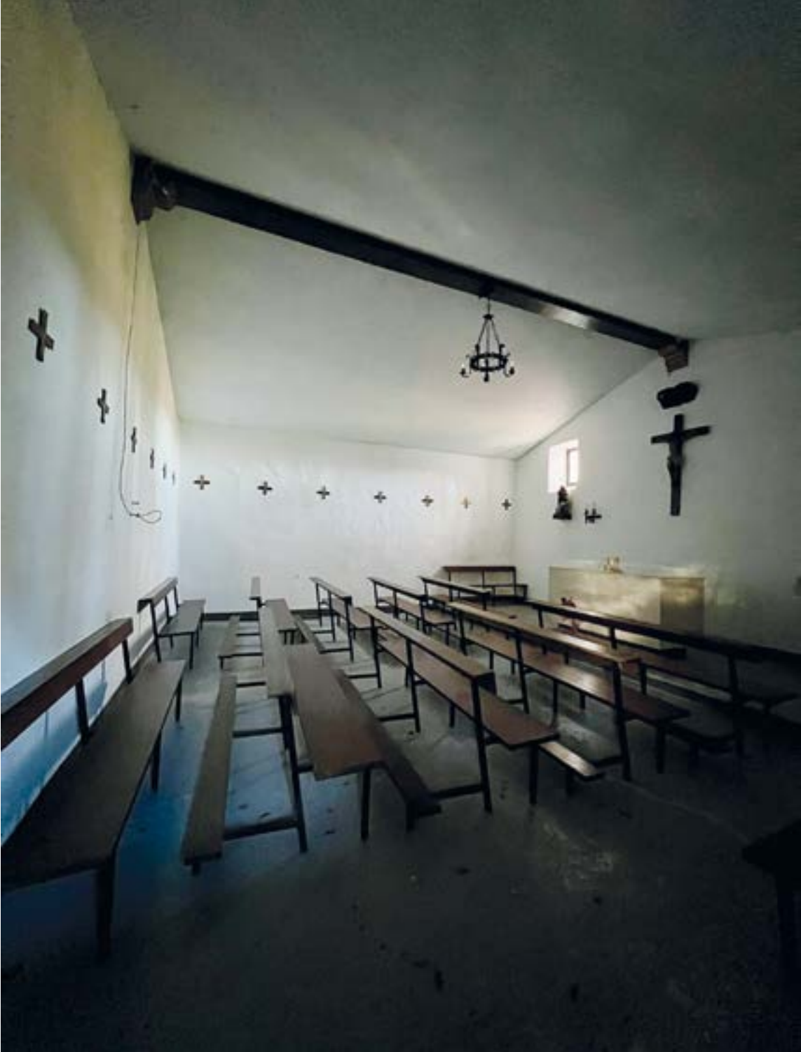
Gurutzeak kontatzeko aukera polita... asteburuko Santa Kurutz jaietan. RAMON BEITIA