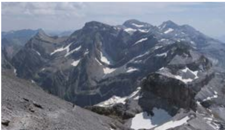
312 mendien zerrendan denetarik aurki ditzakete erronkan parte hartu nahi dutenek.

Mendia igo ondoren, klubaren webguneko "Nire Igoerak" dioen atalera igo daitezke argazkiak edo, eposta bidez, 312@deporeibar.com helbidera bidali daitezke. Argazkiak klubaren Instagram kontuan ere argitaratuko dituzte.