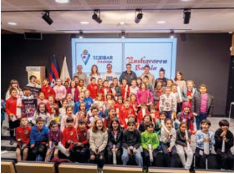
Aurtengo edizioan Elgoibarko ikasleek ere hartu dute parte egitasmoan.