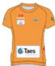
23 URTEKAZPIKO ONENA