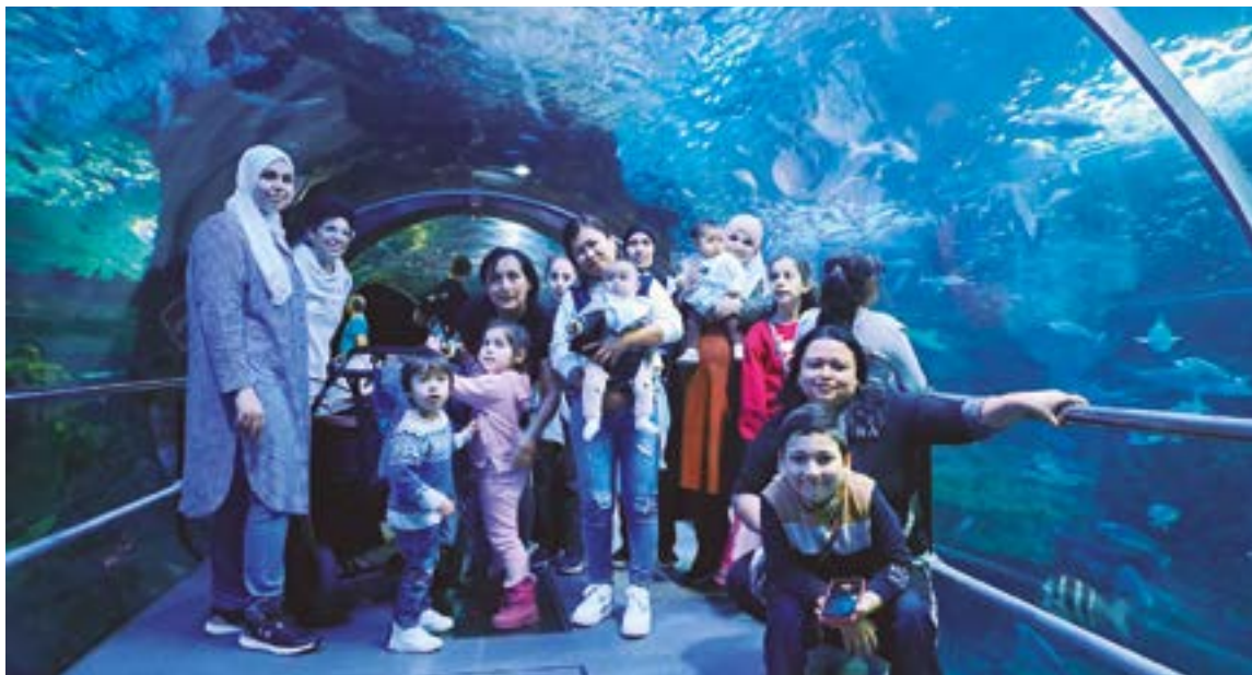
Ongi Etorri Berbetan programak berebiziko garrantzia du Berdintasun eta Aniztasun Planean...ETA KITTO! EUSKARA ELKARTEA

landu behar da, baina ez atzerriko jendearen gizarteratzea bakarrik, baizik eta gizarte guztiarena. Denok egin behar dugu ahalegina gizarteratzean laguntzeko. Kultur-aniztasunaren inguruan eta sentsibilizazioarekin zerikusia duten ekintzak egin behar dira, eta elkar ezagutza sustatu behar da. Eta, bestetik, plan honetan jasotzen den jauzi kualitatiboa transbertsalitatearen eskutik dator. Kultur aniztasuna zeharkako gauza bat da. Ez da immigrazio teknikariak edo Gizarte Zerbitzuak bakarrik egin behar duten zerbaitekin, planak Udaleko sail guztiek kultur aniztasunaren ikuspegia txertatzeko ordua dela jasotzen duelako”, azaldu digu Errastik.