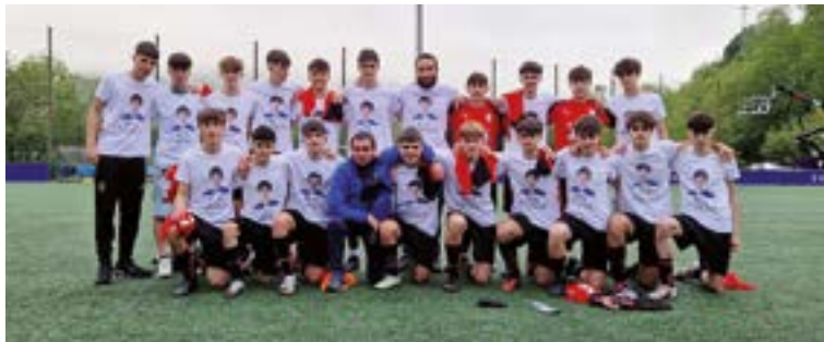
Kantu-afarirako eta herri-bazkarirako tiketak hilaren 22rako erosi daitezke.

Urki futbol klubeko ordezkariak ahaztu ezinezko denboraldia dihardute egiten. Horrela, Erregionaleko Gorengo Mailan jokatzen duen Urki JMR lehenengo taldeak hirugarren postuan amaituko du, Mondragon eta Aloña Mendiren atzetik, aste-buru honetan amaituko den liga. Harrobiko taldeen artean, bestalde, jubenetako Ohorezko Mailako Urki Alkidebak, Euskaldunari 2-3 irabazita, jardunaldi bakarra-