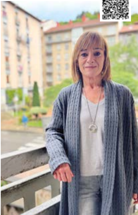
Zurumurrueen aurkako solasaldian hartuko du parte Arresek.