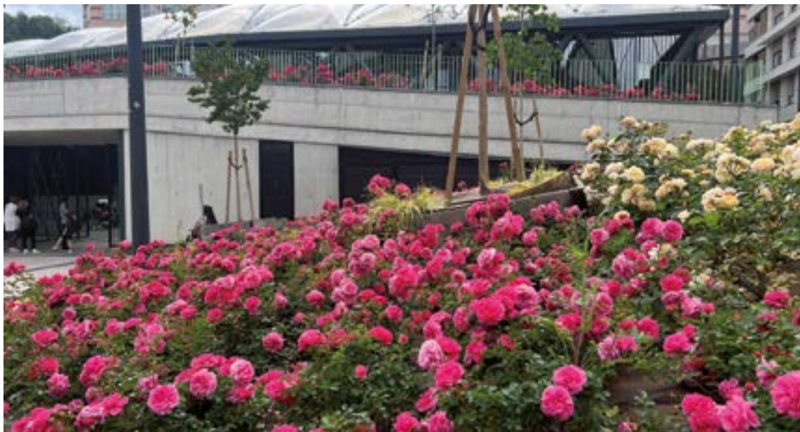
Errebal Plazaia inguratzen duten lorategiak. EKHI BELAR

errazten digu. Loreak euskarri batean etortzen dira, substratuarekin eta bestelakoekin, eta horrela ez gara lore bakoitza banan-banan moztzen eta landatzen ibili behar. Pentsa zer izango litzatekeen 5.000 lore modu horretan landatzea, denbora ugari beharko genuke. Beraz, egiten duguna da lore zaharra kendu eta berria jarri”, azaldu digu Rodriguezek.