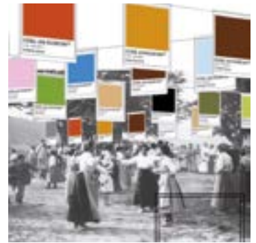
Sormen Tailerrak bere lanak erakutsiko ditu zapatu goizean zehar.

Aurtengoa hirugarren edizioa da, orain dela aste batzuetatik hona garatzen joan dena. Klub Deportiboko pilota batzordeak duen palako azpibatzerdeak antolatutako torneooko herriko txapelketan zortzi bikotek hartu dute parte, eta federatuen txapelketa irekian kopuru horren bikoitzak: “Hamasei horietatik bost bikote Eibarkoak dira”, dioskue antolatzaileek. Bi lehiaketetako finalak hilaren 25ean jokatuko dira, beste partidu guztiak bezala Astelena frontoian: zapatu horretako jaialdia 11:00etan hasiko da eta 13:00etan amaituko, “ber-