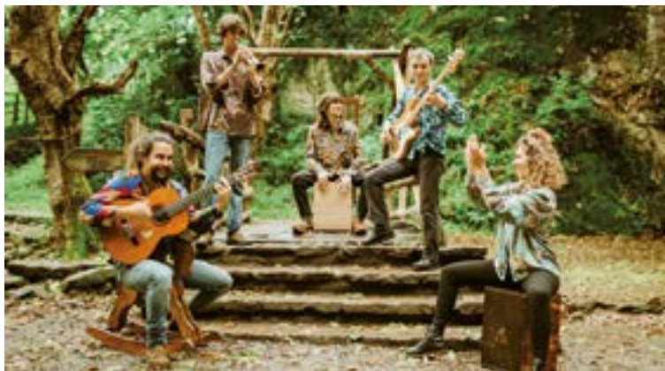
Kilimak taldeak Mugi Panderoarekin joko du barixaku gaueko kontzertuan.

Klub Deportiboko Kultura batzordeak antolatzen duen Euskal Jaiak 59. edizioa beteko du aurten. Ohikoari jarraituz, maiatzaren azken asteburuan garatuko du egitarauaren zatirik handiena. Hala ere, badira hainbat ekitaldi aldeztu aurretik lotzen joatea komeni dena, tartean afarirako eta bazkarirako izen-emateak. Dagoeneko jaietako kartela eta triptikoa kalean badira ere, hemen doakizue horren aurrerapen bat.