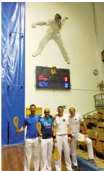
Euskal Jaiko pala torneorearen 3. edizioa azken fasean dago honezkeroko.