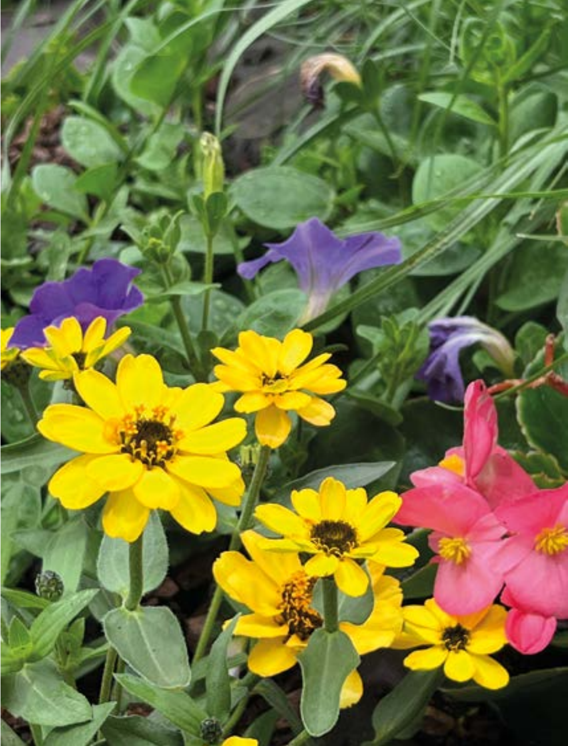
Koloreen eztanda. EKHI BELAR