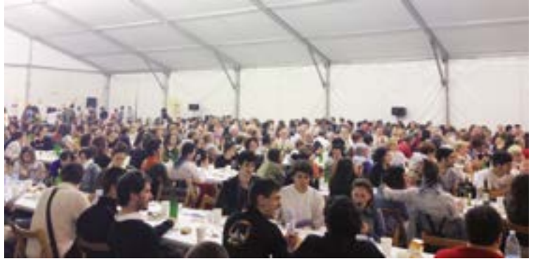
Kantu-afarirako eta herri-bazkarirako tiketak hilaren 22rako erosi daitezke.

Arrate Kultur Elkartearen eskutik antolatutako “Euskal Jaia koloretan” instalazio kolektiboa izango da aurtengo berritasunetako bat. Antolatzaileek diotenez, bertan “aniztasuna, ospakizuna eta Euskal