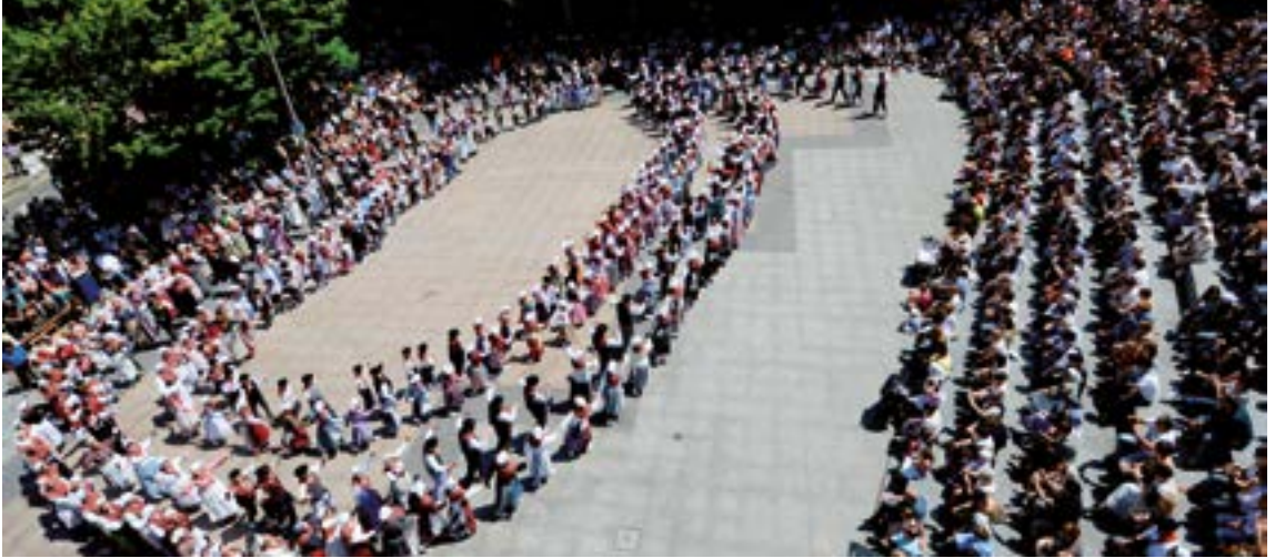
Domeka eguerdiko dantza jaialdian herriko Kezka taldearekin batera Iruñeko Duguna dantza taldea arituko da. FERNANDO RETOLAZA

rrekin lantzeko eta dantzatzeko, Iribasko ingurutxoak eta Imotzeko esku-dantza bertako protagonista bihurturik. Biak Nafarroako dantzak dira eta biak Donostiako Argia dantzari taldeak bildu eta ezagutzera eman zizkieten Euskal Herri osoko dantza taldeei.