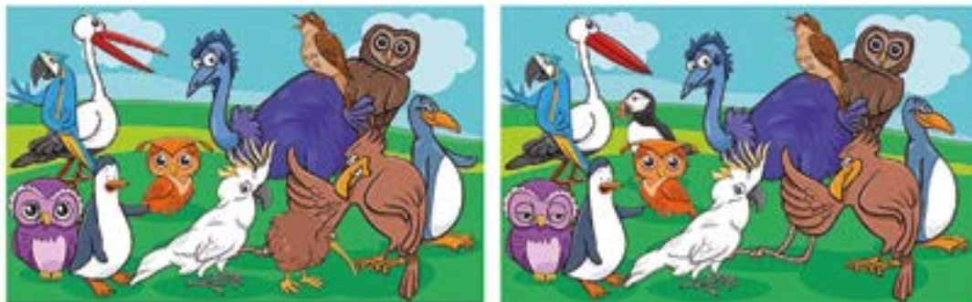
AURKITU 7 EZBERDINTASUNAK