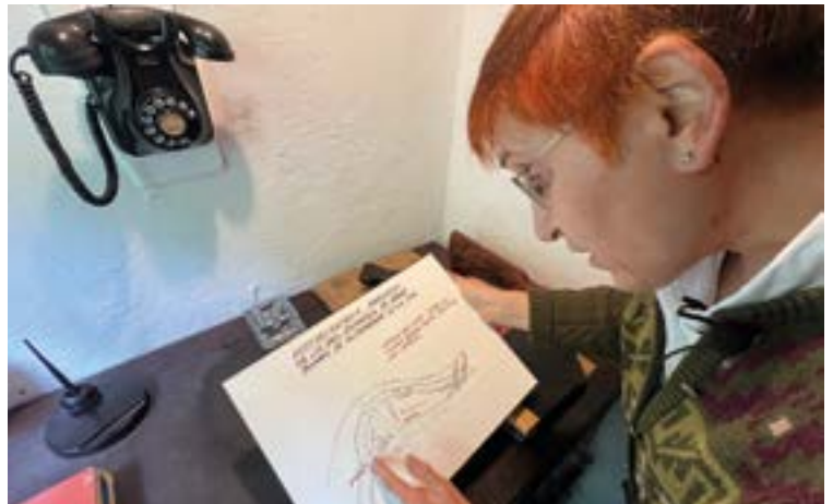
Eskopeten kanoiak egiten zituzten Zamakolatarren tailerrean. EKHI BELAR

ren, baina Demiblockak ez, kanoi arruntak bakarrik, azken horiek Maria Angela kaleko tailerrean egiten zirelako”, azpimarratzen du.