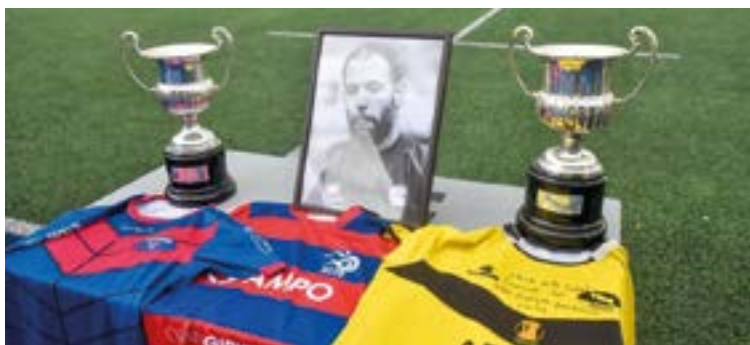
Urtzi gogoratzeko zenbait ekitaldi egin dituzte bere heriotzaren ondoren.