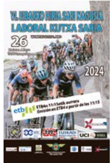
Aurtengo edizioko kartela.

tzeko, helmugako 1. mailako Arrate. Lasterketak oraingoan Arraten izango duelako amaiera, Euskal Jaia ospatzen denez proba herri erditik ateratzeko ahalegina egin baitute antolatzaileek: "Arrateko igoeraren berritasuna Azitaingo poligonotik egingo dela da, horrela epikotasun puntua emanez probari". Irabazlearen helmugaratzea 13:00ak baino zertxobait lehenagorako espero da. EITB4-k zuzenean eskainiko du lasterketa 11:15etik aurrera, baina streaming bidez ikusi ahal izango da proba osoa klubaren web orritik.