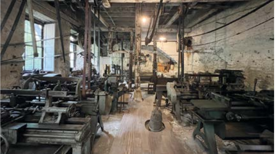
Otaola kalean dago Zamakolatarren tailer-etxea. EKHI BELAR

etxea duelako gainean, baina gaur egun ere ura nondik iristen zen ikusi daiteke oraindik. Izan ere, lantegi-etxera bisita eginez gero, ubidera ematen duten zenbait zulo eta sarbide ikusteko aukera dago. Baita ur-gordailua ikusteko aukera ere.