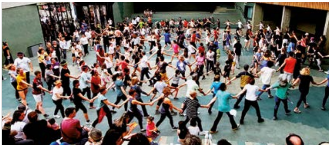
Azken hilabeteotan Errebal Plazan egindako entseguetan zirenak eta ez zirenak egin dira dantzari dagoeneko. OIER ARAOLAIZA

Eibarko dantza taldearen historian garrantzi berezia izan duen erreperitorioa hautatu dute elka-