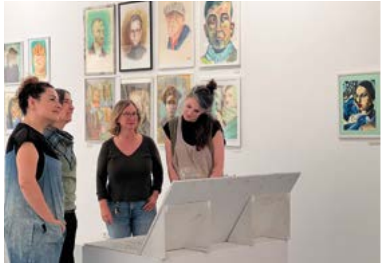
Dibujo Eskolak eta Zeramika Eskolakoek erakusketa zabaldu dute. EKHIBELAR

Gauzak lantzeko orduan, irakasleak ikasleen arabera moldatzen dira. Hasieran oinarrizko teknikak erakustea ezinbestekoa den arren, zeramikaren mundua oso zabala denez, gauza ezberdin asko egiteko