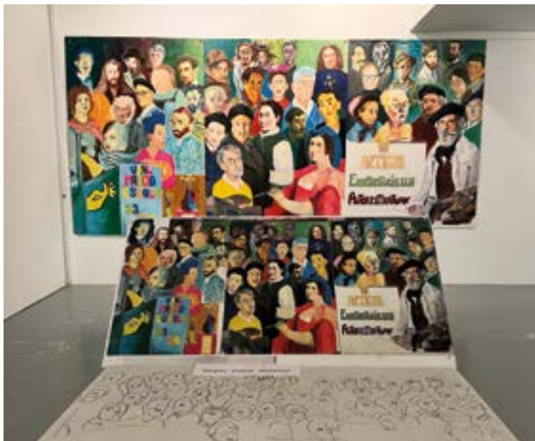
Ikasturtean egindako lanak erakutsi dituzte Portalean herriko artistek. EKHI BELAR

XX. mendean margolaritza lantzen hasi ziren eta eskolaren helburuak aldatzen joan ziren. “Armaginezaren lotura ez zen hain nabaria eta arte ederretako munduarekin lotzen joan zen”, irakaslearen berbetan, gaur egungora gerturatuz.