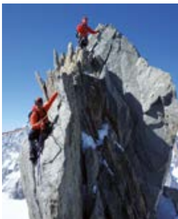
Dent du Geant mendia da proposatutako mendi bat, Frantziako Alpeetan.

Deporten mendeurrenaren bueltan mendi batzordeak antolatutako bi erronka horietan badoaz mugarriak gainditzen. Baietz 312 Mendi!-koan, ekainaren 11rako 124 igota zituzten, 39 zain eta 149 egin gabe, proposatutako beste birekin batera: Marokoko Atlasen dagoen Tubkal (4.167 metro) eta Frantziako Alpeetan kokatutako Dent du Geant (4.014). Proiektu horretan mendi errazak, zailak, bereziak, ederrak, itsusiak... Egindakoen artean daude, esaterako, Teide (3.715 metro) edo Balaitous (3.146), altuenen artean. Eibarko inguruetan edo Euskal Herrian dauden beste hainbat tontor ere zapaldu dituzte (klubeko banderatzkoarekin egindako argazkiak iagoera egiaztatzen du).