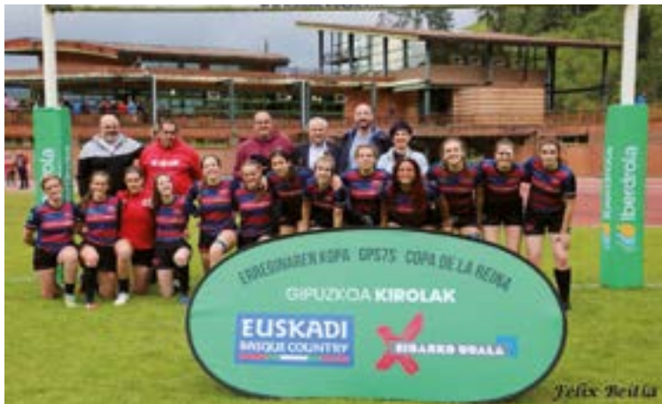
Eibar Rugby Taldeak 15-12 galdu zuen finalean Sant Cugat taldearen aurrean.

Unben asteburuan jokatuak Iberdrola Erreginaren Kopako lehen fasean eibartarrek maila bikaina eman zuten, finala jokatzearaino. Final horretan azken bi txapelduen arteko ikusi ahal izan zen: alde batetik, eibartarrak, iazko txapelduak; eta bestetik, 2022an torneo irabazi zuten Sant Cugatekoek. Azken partidu horrek bi zati guztiz desberdinak izan zituen: lehenengoan kataluniarrak gehiago izan ziren, 15-0koarekin aldageletara joateko, baina handik bueltan eibartarrak nagusitu ziren, azken emaitza 15-12an lagatzeko. Asteburuan jasotako puntuekin, eta beste bi faseak jokatzeko zain, gaur egungo sailkapena honela dago: Sant Cugatek 20 puntu ditu, Eibar Rugbyk 18, CRAT Rialta Sevenek 16, Rugby Turiak 14, Olímpico de Pozuelok 12, Complutense Cisnerosek 10, Jabatas de Móstoles 8,