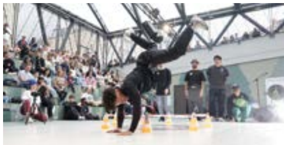
Breaking Eibar Eibarko IX. Break Dance eta New Style txapelketa egin zen zapatuan Errebal Plazan.