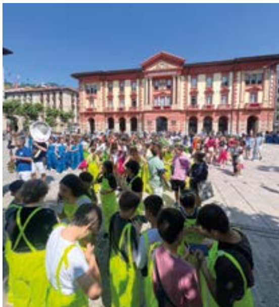
Aurtengo edizioan jokoak ez dira zezen plazan egingo, Untzagan baizik, eta herriko kuadrillak daude deituta bertan parte-hartzera

Prebisioa ikusita, badirudi eguraldia lagun izango dutela. Beraz, kuadrillek ikuskizun entretenigarria eskainiko dutela aurreikusi daiteke. Onenak irabaz dezala eta denek gozatu dezatela!