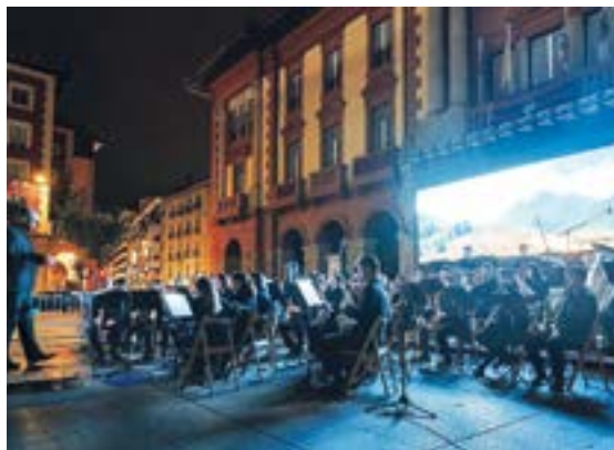
Eibarko Musika Bandak ikuskizun bikaina eskaini zuen 'Eraztunen jauna' sagaren musikarekin.