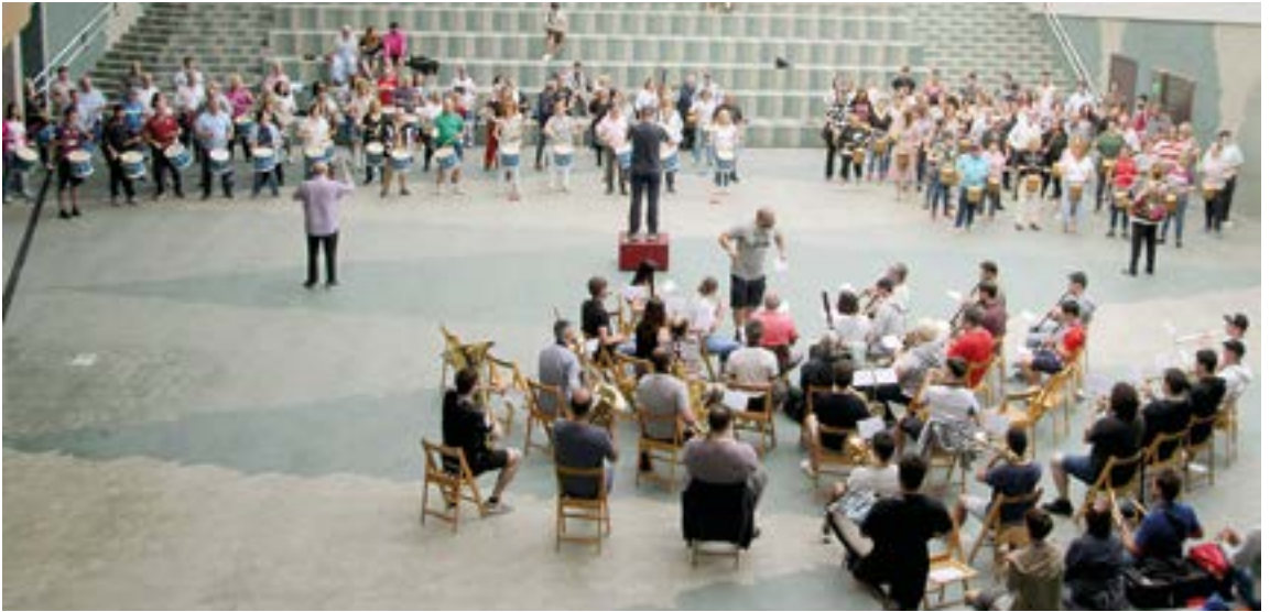
Aurten, helduen danborradarako azken entsegua Eibarko Musika Bandarekin batera egin dute estreinekoz. Martitzenean elkartu ziren partaide guztiak Errebal Plazan, joko dituzten kantuei azken erreposoa emateko. SILBIAHERNANDEZ.

pareko plazara gauerdian sartzea dago aurreikusita, Eibarko Musika Bandarekin batera, 00:00etan San Juan Himnoa eskaintzeko. Eta, alkateak Diana zuzendu ondoren, azken piezak joko dituzte: Donostiako Martxa , Kosakos del Kazan , Konparsa de viejas eta Pantxika . 00:30ean Marrukoren kanoikada bigarren bez bota eta, Tatiagorekin amaitzeko.