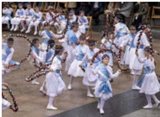
Kezka Dantza Taldeak kudeatzen duen eskolako taldeek erakustaldi ederra egin zuten barixakuan, Dantzari Egunean.