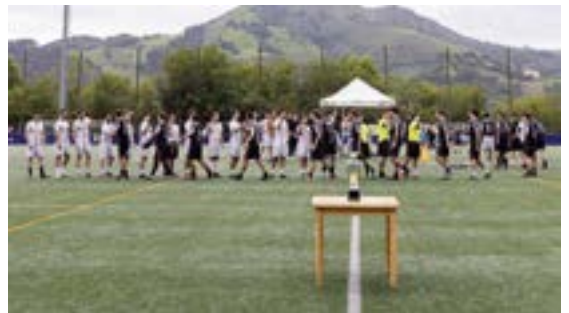
40 talde inguruk hartu zuten parte zapatuan Unben jokatu zen futbol 7ko txapelketan. Txapeladuna ABC'S taldea izan zen.