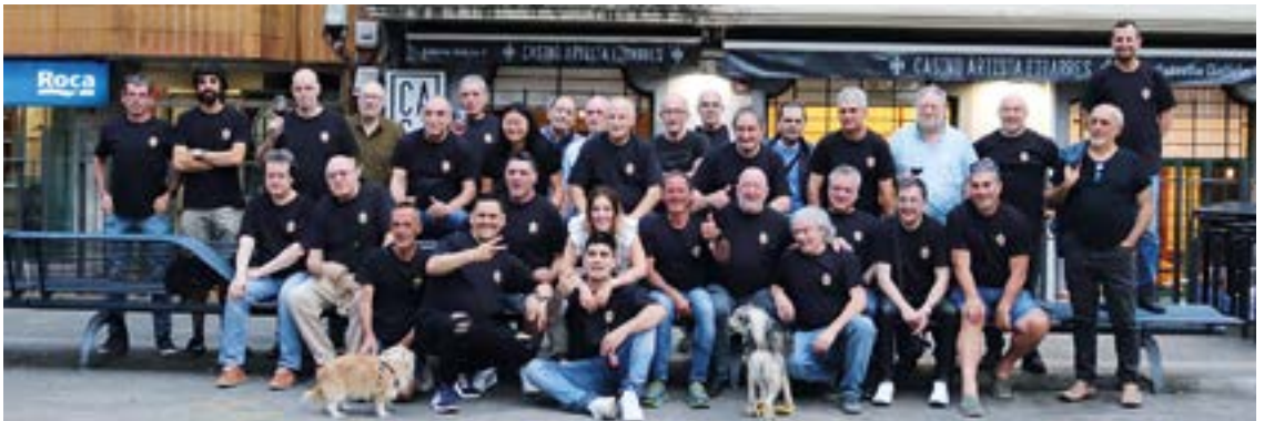
Roblesekin Ereñari irabazi zion domekan jokaturako Casino Artista Eibarresen Sanjuanetako Txapelketaren hirugarren edizioko finalean.