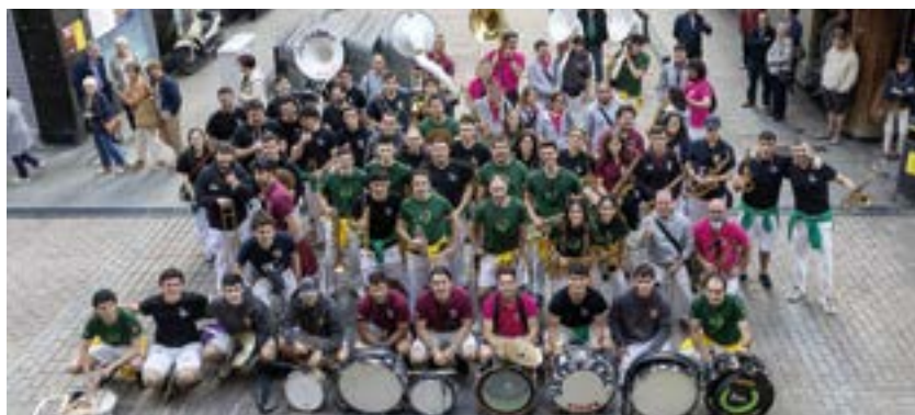
Eibarko Txaranga Egunaren lehen edizioak harrera paregabea izan zuen herrian.