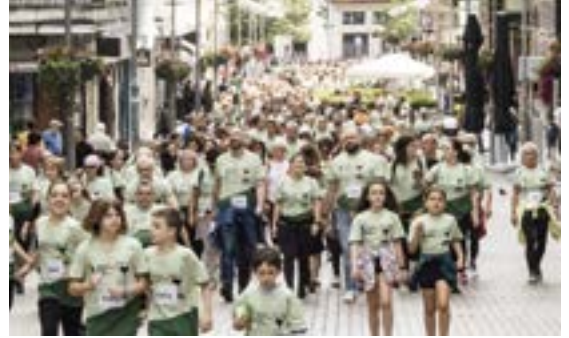
Minbiziaren Aurka Gipuzkoan-ek antolatutako martxa solidarioan 1.000 lagun baino gehiagok hartu zuten parte.