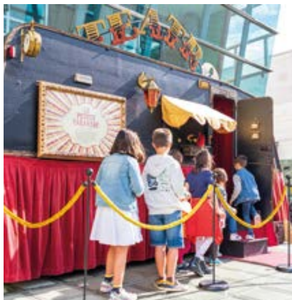
Mende bat atzera egingo dugu 'La petite caravane' antzokian.

Adrian Conde artista asturiarrak XX. mende hasierako antzokien esentzia ekarriko digu ekainaren 25ean, goiz eta arratsalde (11:30etik 14:30era eta