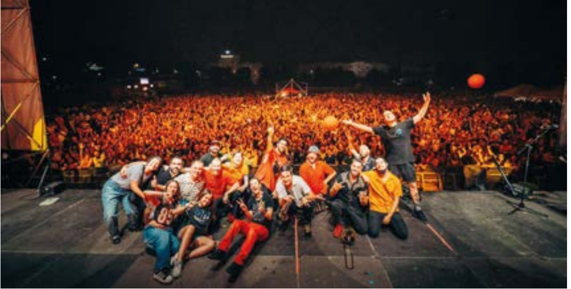
La Pegatina talde kataluniarrak dantzan jarriko du Untzaga bihar gauean.

kuadrillak elkartuko dira toki berean Urkizuraino kalejira egiteko eta Ustekabe txaranga izango dute bidelagun. Eta ez da txaranga entzuteko izango dugun azken aukera, 17:00etan Untzagan egingo diren kuadrillen jokoetan ere egongo direlako giroa jartzen.