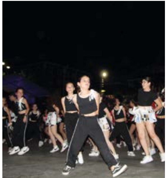
Eibarko Udal Dantza Akademiakoek dantzak izango dira sua piztu aurretik.

Aurten, askotan egin bezala, Dantza Akademiak gai humanitario batean jarriko du arreta dantzak egiteko orduan. "Dantzaren bidez, gatazka armatuek haurtzaroon duten eragina ikusarazi/salatu nahi dugu. Horiek ordaintzen dute preziorik altuena. Betiko orbain emozional eta fisikoak utziz. Koreografia hau gatazketan eta krisietan harrapatuta dauden eta errugabetasuna kentzen dioten haur guztiei eskaintzen diegu. Salba dezagun Bambi! Ez dezagun bizirik hiltzen utzi!", diote dantza akademiatik.