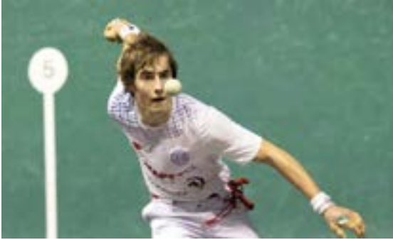
Eibarko Klub Deportiboko Pilota Eskolakoek San Juan torneoko finalekin amaitu zuten denboraldia.