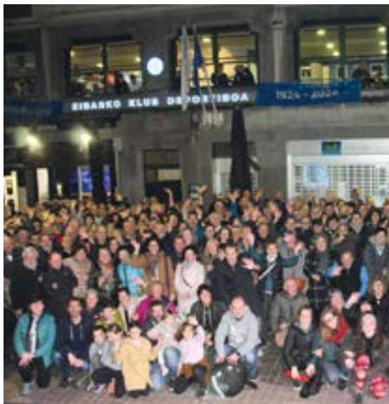
100 urte bete dituen Eibarko Klub Deportiboa omenduko dute aurtengo danborradaren karrozan.