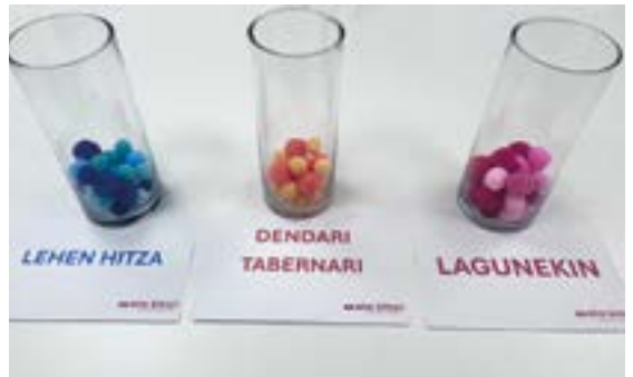
Euskararekiko konpromiso maila kolore ezberdinekin irudikatzen joateko joko modukoa prestatu du ...eta kitto!-k.

standera hurbiltzen direnek kristalezko ontzi batzuk koloretako harriekin bete beharko dituzte, parte hartzaileek euskararekiko hartzen duten konpromisoaren arabera: urdina saltoki edo ostalaritza establezimendu batera joatean “lehen hitza euskaraz” bada; laranja, “elkarriketa euskaraz hastea” bada; eta arrosa “elkarriketa euskaraz mantentzea” bada.