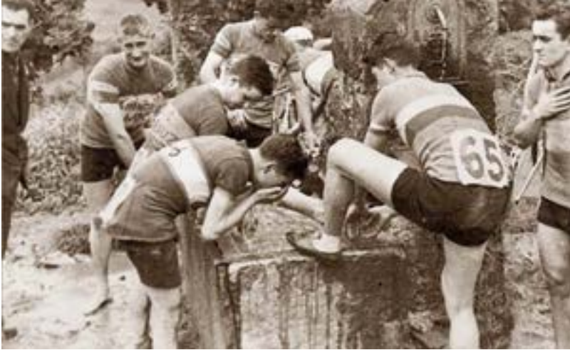
Arrateko afizionatuentzako III. Igoera. EGOIBARRA BATZORDEA

1943 inguruan Klub Deportiboa Calbeton kalean zegoen. Txirrindularitza sailerako norbait behar zutela esan zioten, eta bertan hasi zen. Arrateko Igoeraren hastapenak azaltzen ditu: bidea oraindik harrizkoa zen; sariak zenbatekoak ziren, etab.