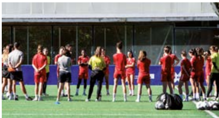
Gizonezkoen taldea baino astebete geroago hasiko da lanean emakumezkoena (hilak 18).

Abuztuak 17: A Coruñaako Deportivo Abanca - Eibar