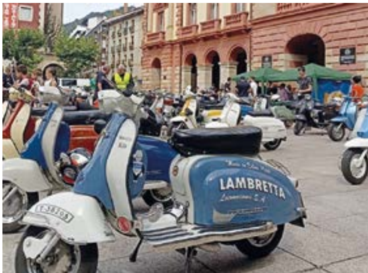
Mimo handiarekin zaindu eta zaharberritu dituzten Lambretta motorrak goizez eta arratsaldez erakutsiko dituzte bihar Untzagan. EIBARKO LAMBRETTA KLUBA