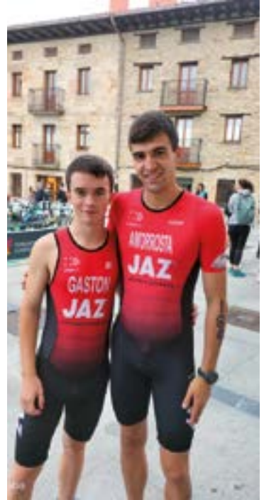
Gaston eta Amorrosta euren mailetako hamar onenen artean izan ziren Legution.