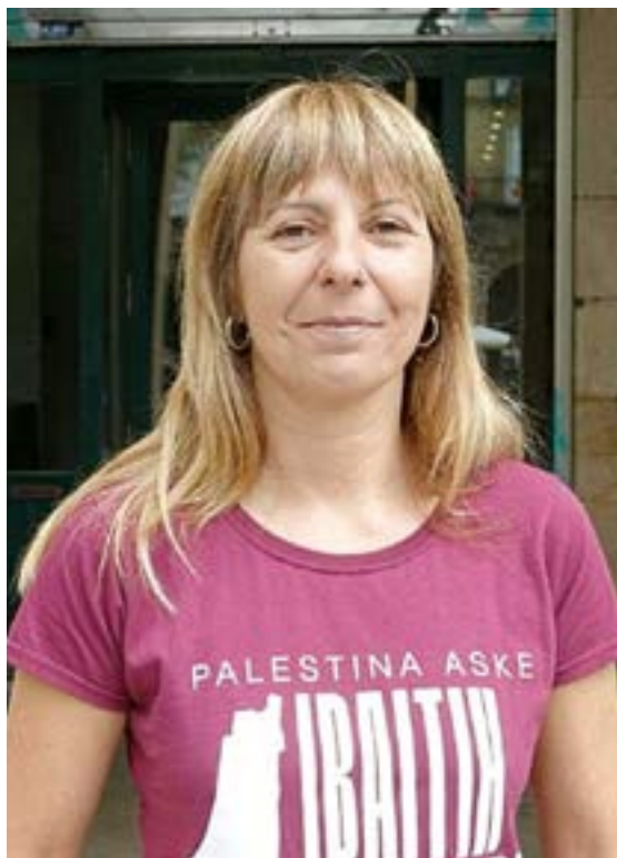
Bilbon, Euskaltzaindiaren egoitzan egindako topaketan, euskalduntze-alfabetatzea aztertu dute, intersektionalitatearen ikuspegitik. ELKARRIZKETA ETARGAZKIA: UEU.

BASKALE Elkarte formalki 2010. urtean sortu zen alemaniar eta euskaldun batzuen artean. Elkarte soziokulturala da. Baskaleko proiektuak ez dira akade-