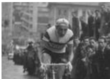
Eibar eta bizikleta, urteetako lotura.

Txirridularitzak gure herrian duen presentzia bestela ere nabarmena bada, oraingoan ohiko egutegitik kanpoko beste proba bat biziko du: Klub Deportiboko mendeurrenaren barruan biharko prestatu duten afizionatuen mailako lasterketa berezia. Deporrek urteetan antolatutako Arrate Igoera nahi izan dute antolatzaileek errekuferatu, "baina horrelako proba laburretarako tarterik ez dago egun, eta kilometro gehiagokoa egin behar izan dugu". Hori bai, lasterketak gurean hasi eta Arraten izango du amaiera.