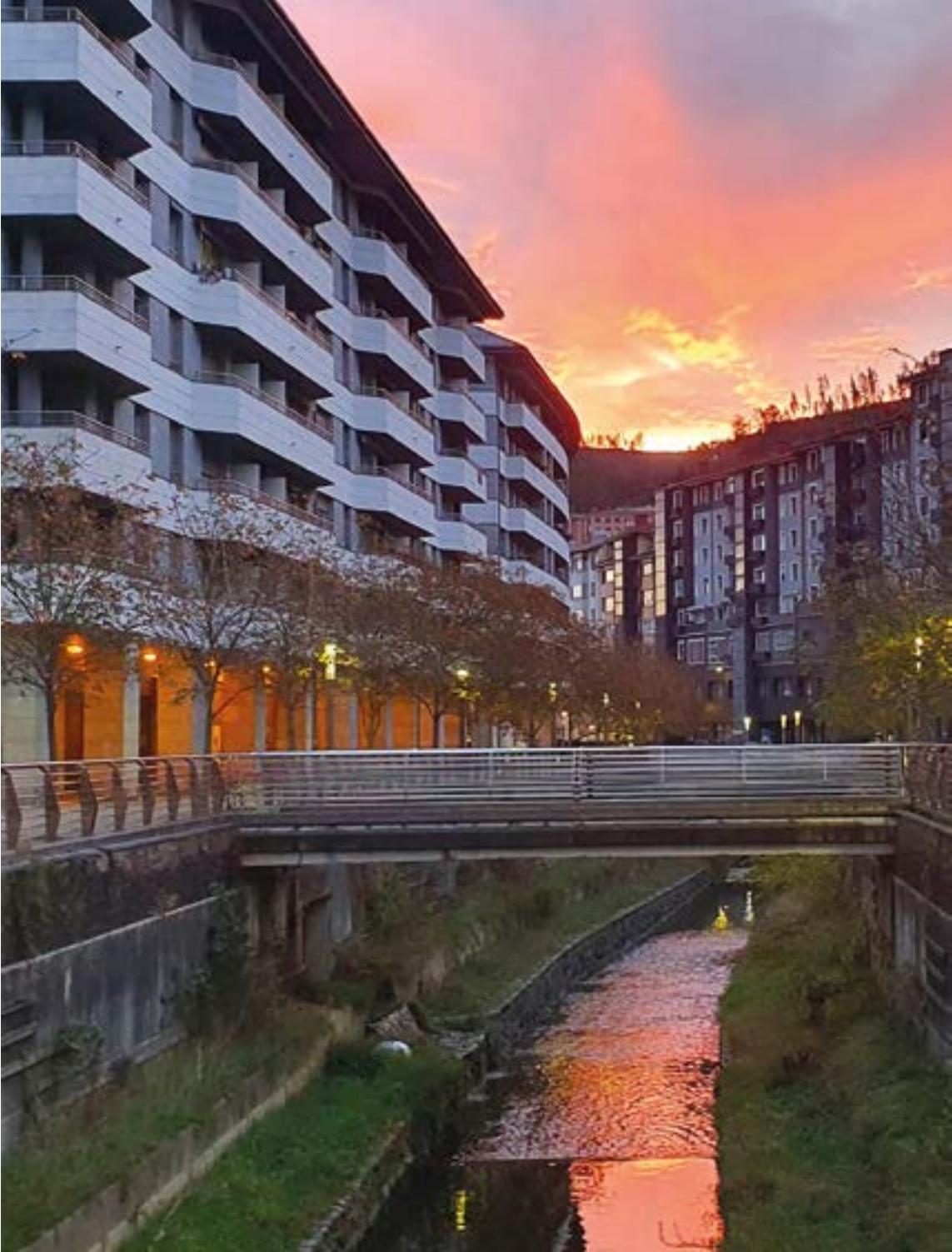
Zeru lurrak gorritzen. RAYMUÑOZ