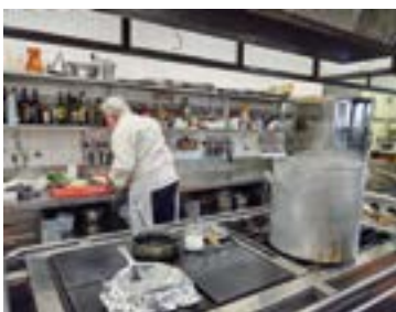
1970 bueltan sortu ziren elkarte gehienak.

H orretaz aparte, ezin dugu ahaztu elkarte gastronomiko horiek sukaldaritza-eskola ere izan direla askorentzat, Karlos Argiñanok berak ...eta kitto!-k orain dela 28 urte kaleratutako “Eibarko Elkarte Gastronomikoak” publikazioaren hitzaurrean zioen bezala, “gure amamengandik jasotako errezetarik goxoenak gorde eta gaurkotuz”.