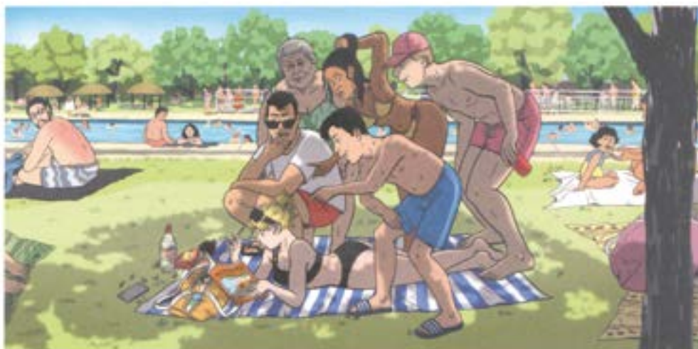
AURKITU 7 EZBERDINTASUNAK