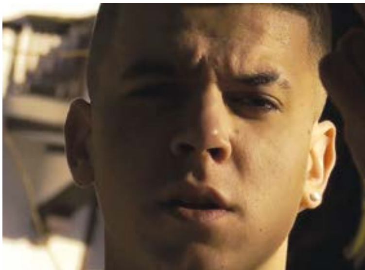
Emeka abeslari eibartarrak hartuko du parte Elgetako saioan.