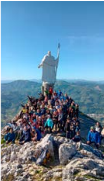
Azken denboraldian Xoxotera egindako irteeraren irudia.