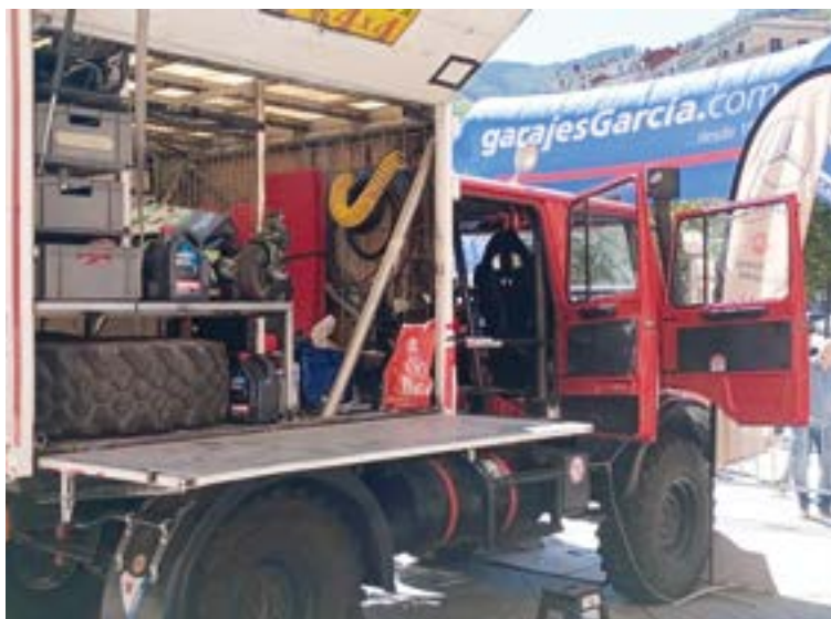
Kamioia Untzagan jarri zuten kanpotik eta barrutik ikusi ahal izateko. ALBERTO ECHALUCE