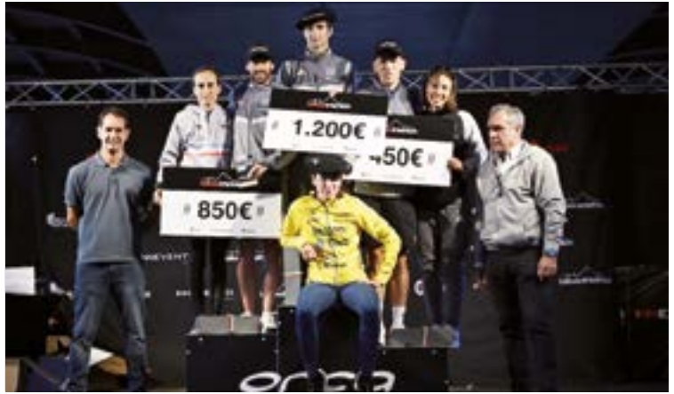
Bilboko Triathloiko podium osoa, probaren amaieran jasotako sariekkin.