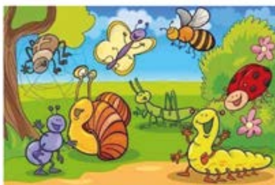
AURKITU 9 EZBERDINTASUNAK