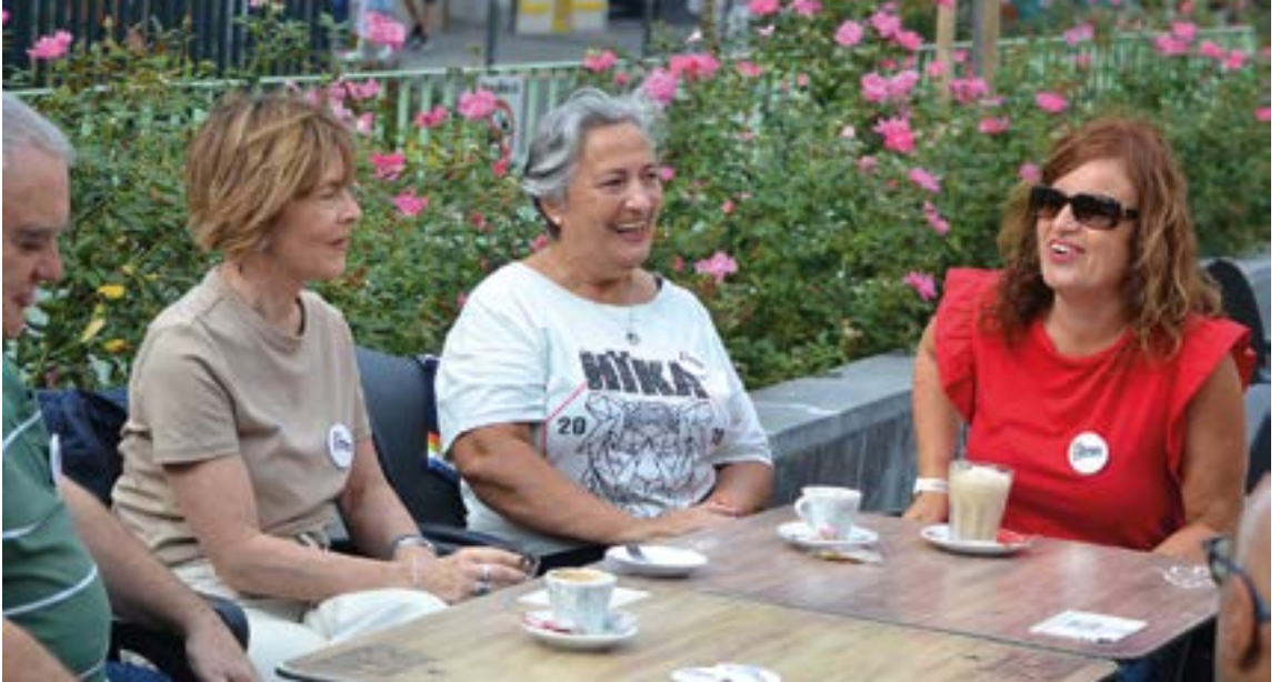
Giro naturalean euskaraz berba egiteko lotsa gaintzen laguntzen die berbalagunei. EKHI BELAR

tean zehar: “Pare bat irteera egiten ditugu, udazkenean bata eta udaberrian bestea. Horrelakoak ere garrantzitsuak dira, talde ezberdinetako kideek elkar ezagutzen dute eta aukera polita izaten da berbalagunen euskal harreman-sarea zabaltzeko”. Iaz Bergaran eta Zeraingo meategietan izan ziren; aurtan, Hondarribi ezagutuko dute bertatik bertara urrian.