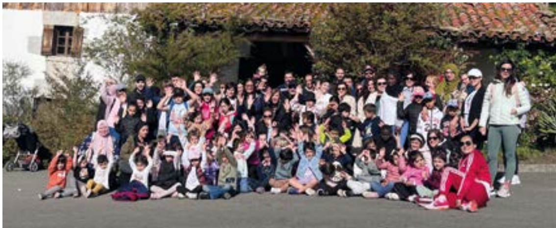
Gurasoen hizkuntza-ohituretan eragitea du helburu Gurasoak Berbetan programak.