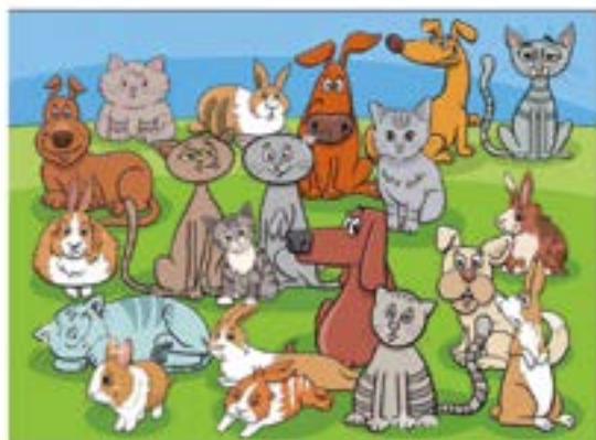
AURKITU 8 EZBERDINTASUNAK