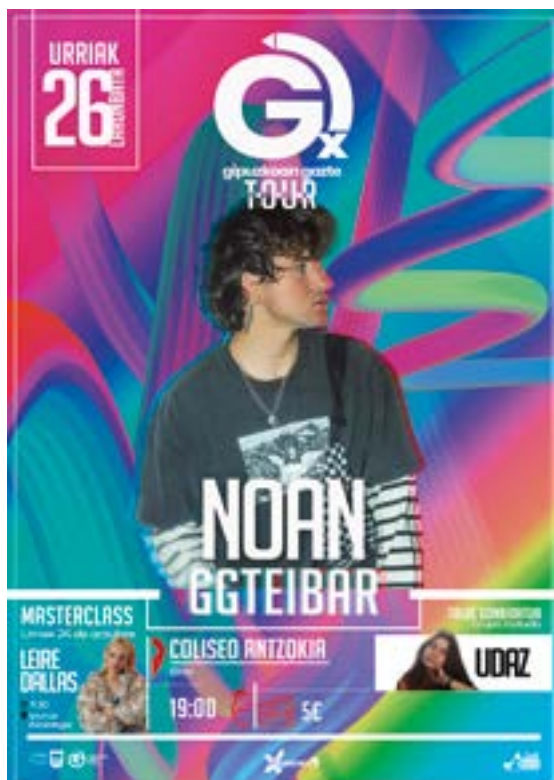
Dantza masterclass-a dohainik izango da, baina parte hartzeko Udalaren webgunean dagoen formularioa bete behar da.