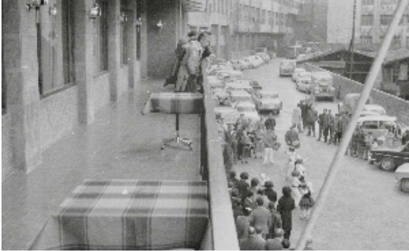
Arrate hotela erreka gainean eraiki zuten gerora. Argazkia inaugurazio eguneko da., hoteleko terrazatik egindakoa. Atzean Alfa ikusten da.

Isasi 10 zenbakian, atze aldean, harraska bat zegoen eta "kunbo" bat ere bazegoen bertan (upel moduko zerbitu). Gerra denboran, gordeleku moduan erabili zen. Ego Gainen zegoen "kunboa" eta hegazkinak zetozenean bertan ezkutatzen ziren.