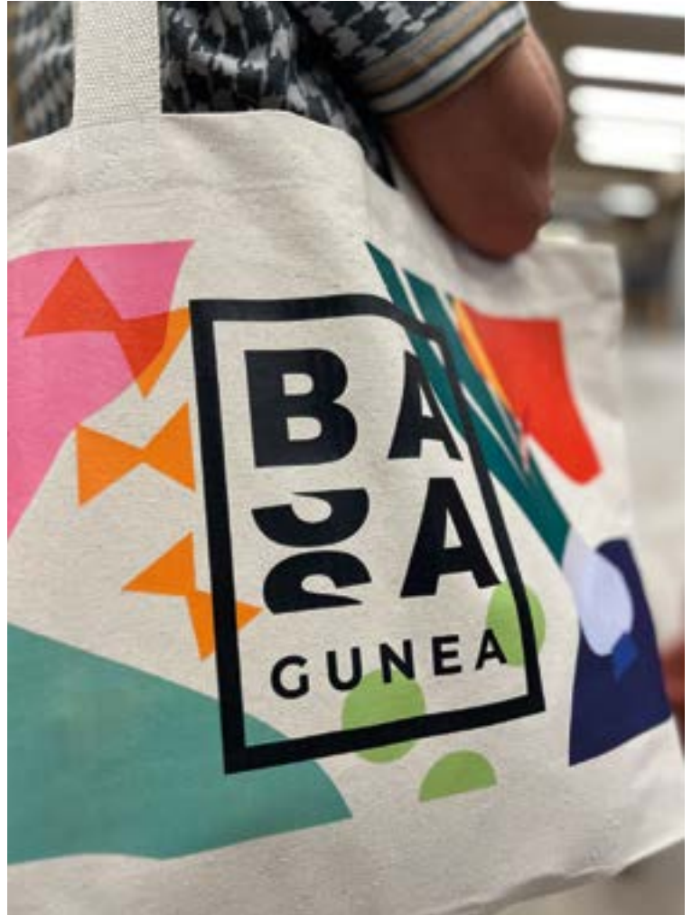
Azataporrua elkartearen eraldaketa da Basagunea. EKHI BELAR

Hauek dira Basagunearen filosofiaren hamar oinarriak: bertan ekoiztu, bertan kontsumitu; zuzeneko salerosketa; elikadura ekologikoa; harremanak saretu; bazkide eta salmenta librea; gertutasuna produktuetan; baita harremanetan ere; elikadura osasuntsua bultzatu; ingurumenarekiko errespetua; kontsumo eredu birplanteatu; eta merkatu plazaren izaera berresku-