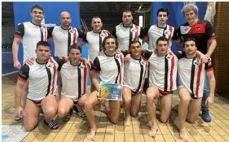
Aurreko denboraldiaren amaieran liga kompetizioa agurtu zuen taldea.