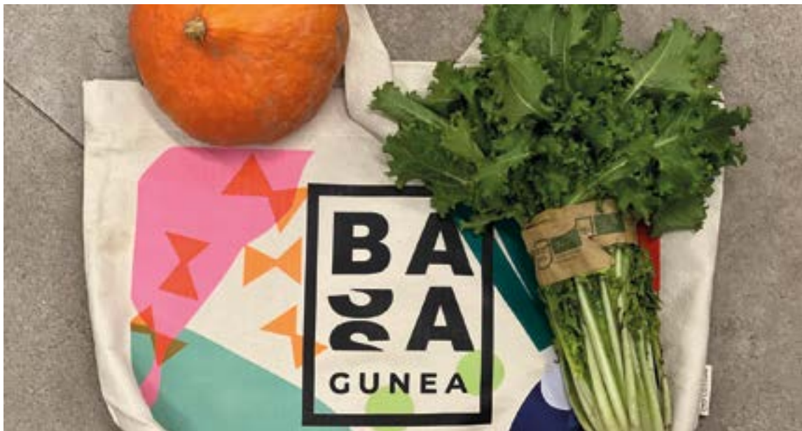
Hurbileko produktu ekologikoak erosi ahal izango dira Basagunean. EKHI BELAR

koak izango dira (fruta eta barazki freskoak, lekaleak, laboreak, esnekiak, ogia, arrautzak, kontserbak, edariak, zizka mizkak, okela...) eta kalitatezko produktuak izango direla bermatzen dute. “Produktu guztiak ekologikoak eta hurbilekoak dira”, diote elkartekoek. Gainera, euren berbetan, “prezioak justuak dira ekoizleentzat eta arrazoizkoak kontsumitzaileentzat”.