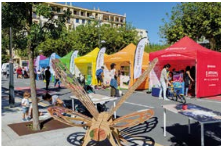
Herri batetik bestera ibiliko den Klima Azoka erakusketa interaktiboa domekan egongo da Eibarren, Untzagan, goizeko 11:30etik 15:00era bitartean.