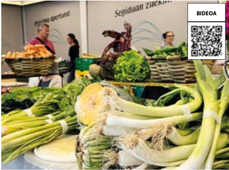
Astelehenetik zapatuta egoten dira baserritarrak Errebalako merkatu plazan. EKHIBELAR