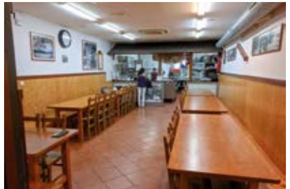
60 bat soziedade edo elkarte gastronomiko daude Eibarren.

Alperrak, Amaña, Asola Berri, Aterpe, Baten Bi, Batuak, Behartsuak, Bekuak, Beti Asarre, Beti Galdu, Beti Jai, Bide Alde, Bomba, Botellin, Buztarri, Centro Burgales, Dardai, Dorrepe, Edozer, Erdi Bana,