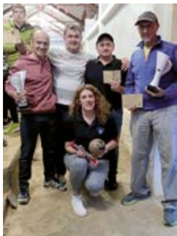
Aramaioko tiraldian izandako bolari onenak, euren sariekin.

Bestalde, estatu mailako txapelketan parte hartzen duten Ipurua Klubeko hiru taldeek Euskadiko Txapelketan hartu zuten parte aurreko domekan eta, "erkidego mailan denboraldiko hitzordu garrantzitsuenetarikoa den horretan", hirugarren postua eskuratu zuten hirurek. Senior mailakoek muntaia konplexuarekin dihardute lanean eta emaitza horrekin ezin izan zuten Espainiako Kopako 3. faserako txartela eskuratu; oinarri junior talde berrituak eta infantil mailakoak ere ondo baino hobeto lehiatu zuten.