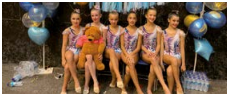
Oinarri infantil mailako Ipurua klubeko taldea ere izango da domekako Torneoan.

Bi tirolina, jumar eta rapel beste bina, 10 metroko trepa sarea eta bi kutxa dorre izango dira Untzagan, zirko eta oreka jolasekin batera. Eta 19:45etik aurrera slackline erakustaldiaz ere gozatu ahal izango dugu, hau da, oreka soka alturarekin. Adin guztietarako egokituko diren aipatutako aktibitateak doakoak izango dira.