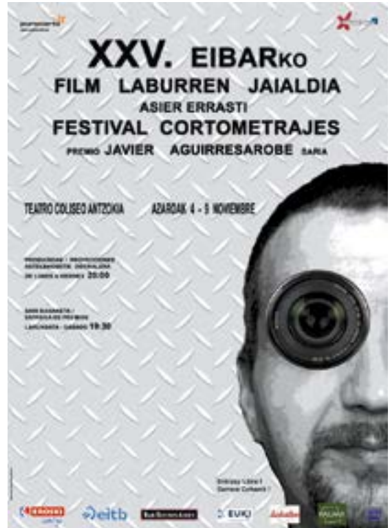
Aurtengo edizioako kartela. Badira 25 urte zikloa hasi zutela.

Martitzenean: "Casting" (7' 13"), animaziozko "Fallin" (10' 43"), "Hotz" (9' 12"), "Macedonia" (14' 40"), "Vida