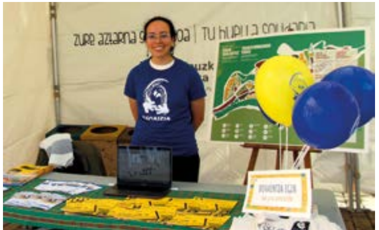
Zapatu goizean Untzagan egin zen azokaren antolatzailetako bat Egoaizia da. Perutik etorritako bi lagunek aukera aprobetxatu eta bertan egon ziren. SILBIAHERNANDEZ

>>> Lankidetzarako laguntzei esker, edateko ur-hornidura hobetu dute, eta haurdun daudenen eta ume jai-berrien gaixotasunak murriztu dituzte, besteak beste