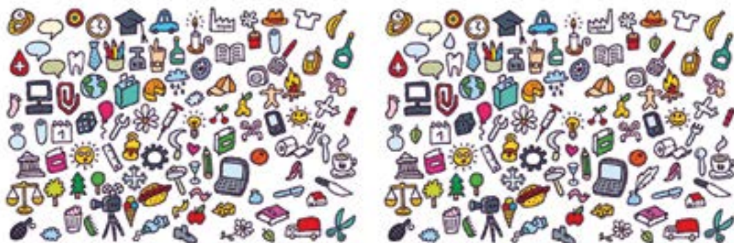
AURKITU 10 DESBERDINTASUNAK