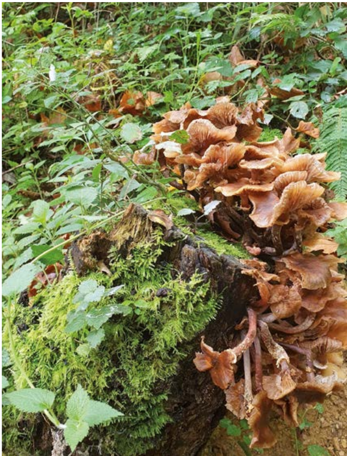
Udazken koloreak. RAYMUÑOZ