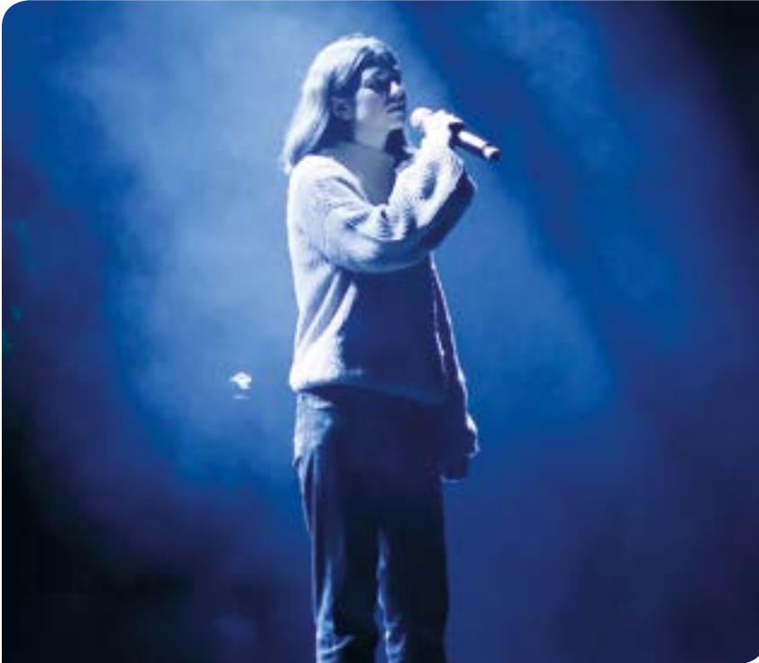
Bakarleri bezala estreinekoz arituko da herrikideen aurrean. UDAZ

“Bihar sei abesti kantatuko ditut, denak originalak, eta gogoia dut abestiak plataformetara igotzeko”