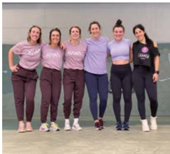
Urtero-urtero jende ugari elkartzten da zumba egiteko izaera solidarioarekin. ZUMBATHON EIBAR