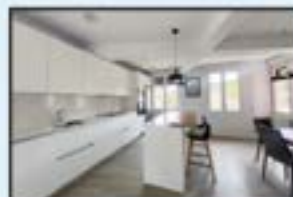
Errebaletik minutura Ref. 202

Bikaina. Bista irekiak. Eguzkitsua. 235.000€