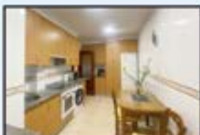
Jardiñeta Ref. 159

3 logela, 2 komun. Pisu altua, bistekin. Iggailua 0 kotan. 189.000€