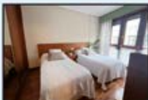
Estaziño Ref. 206

Espaziotua. 3 logela, 2 komun. Trasteroa. Kontsultatu