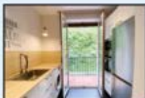
Erdigunea Ref. 204

3 logela, 2 komun. Balkoia. Iggailua. 260.000€