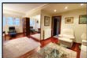
Urkizu Ref. 155

2 logela, 2 komun. 2 balkoi. Espazio zabalak. Kontsultatu