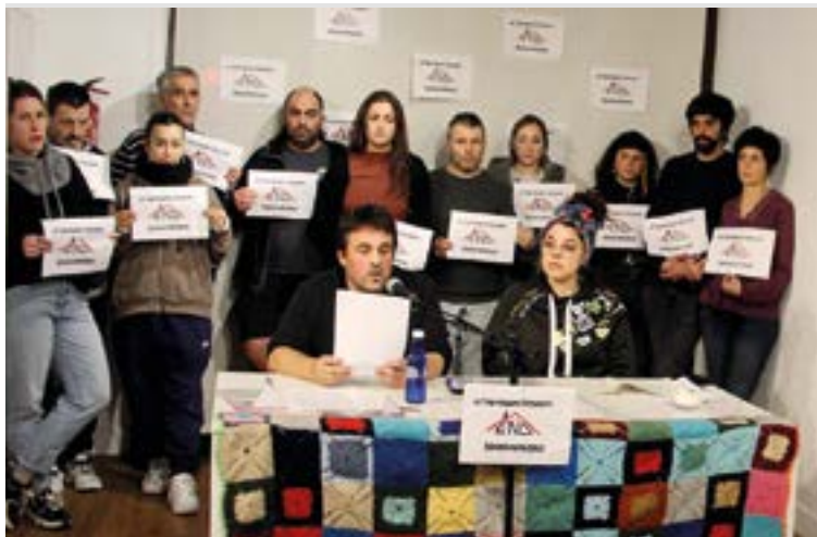
Gaiarekin arduratuta dauden era guztietako herritarrek sortu dute plataforma, indarrak batu eta arazoa konpontzeko asmoz. SILBIAHERNANDEZ