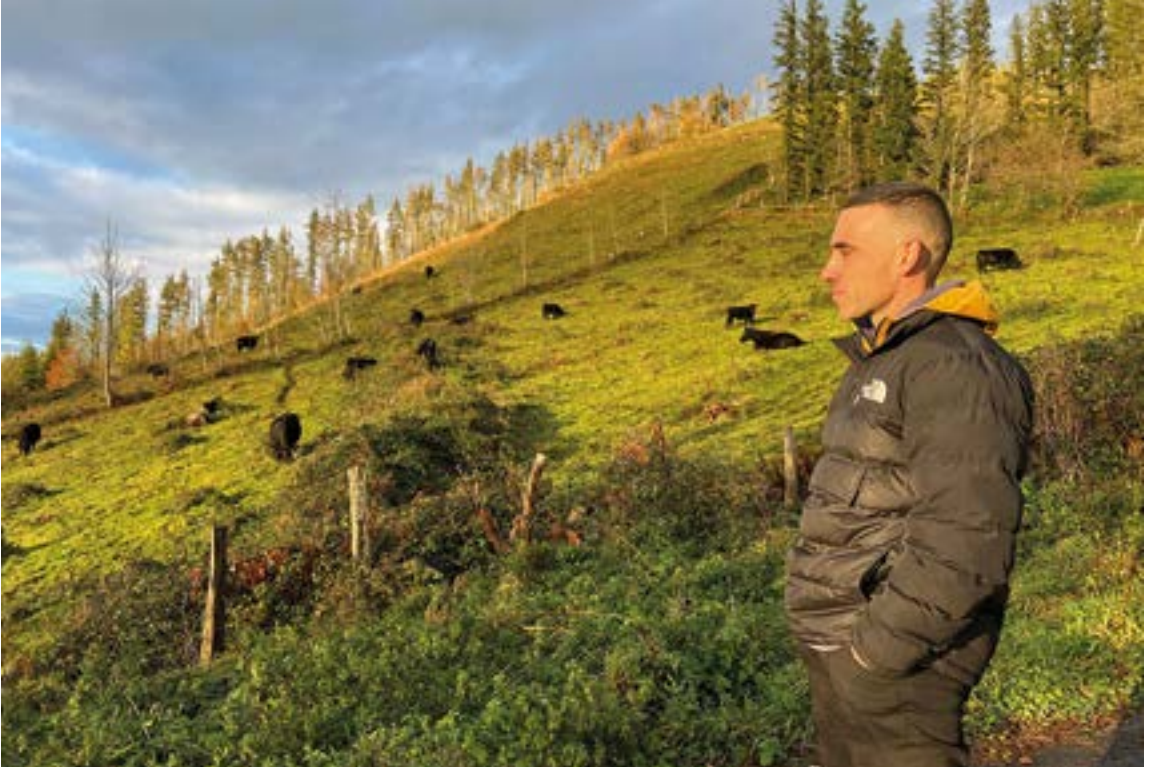
Usartza inguruan ibili dira egunotan Jol eta Andoniren behiak. EKHI BELAR