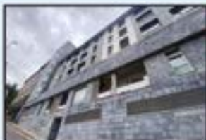
Arane Ref. 146

Berriztua. 2 logela. Iggailua 0 kotan. 168.000€