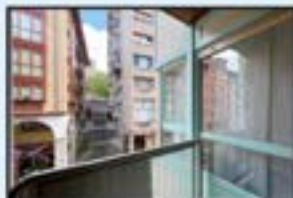
Erdigunea Ref. 211

2 logela, 2 komun. Balkoia. Trasteroa. Garajea. Bista irekiak. Kontsultatu