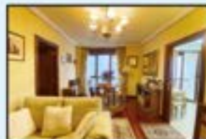
Erdigunea Ref. 106

3 logela, 2 komun. Terraza. Garaje ibdia aukeran. Kontsultatu