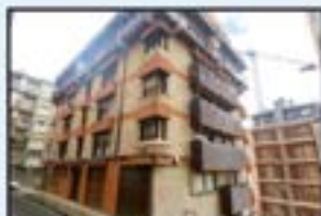
Mutiola Ref. 129

Apartamentu handia, terrazarekin. Trasteroa. 158.000€