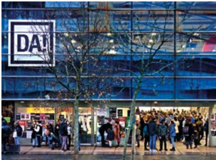
Durangoko Azokak abenduaren 5etik 8ra zabalduko ditu ateak. DURANGOKO AZOKA