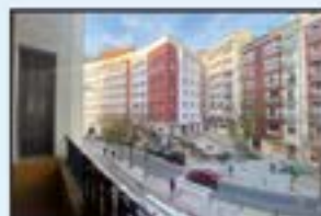
Erdigunea Ref. 170

3 logela, 2 komun. Balkoia. Iggailua. 260.000€