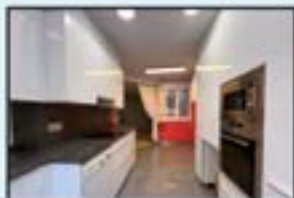
Erdigunea Ref. 181

Berriztua. 2 logela. Iggailua 0 kotan. 168.000€