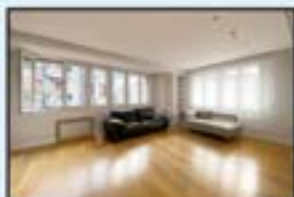
Erdigunea Ref. 200

Bikaina. Etxebizitza zabala eta eguzkitsua. Kontsultatu