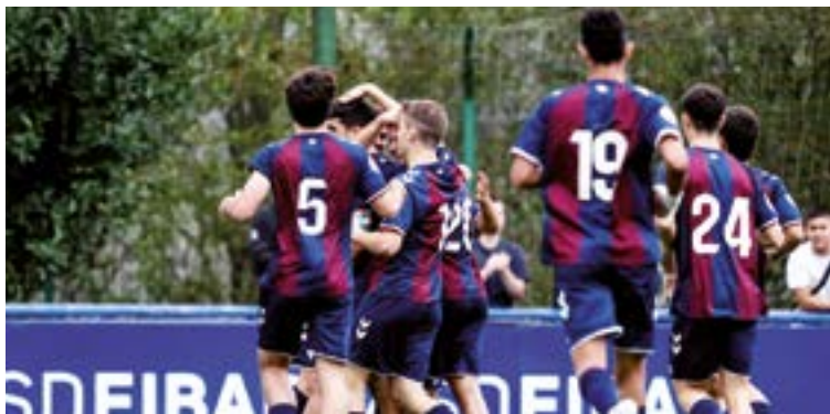
Azkar egokitu dira maila berrietara SD. Eibarko bigarren eta hirugarren taldekoek.

Vitoria filiala zena) bigarrrena da, Arenasen atzetik: bederatzita partidu irabazi ditu, bi berdindu eta beste bi galdu; 20 gol sartu ditu, bakarrik zortzi jasota. Emakumezkoen 2. RFEF Mailan jokatzen duen Eibar B, bere aldetik, laugarren da sailkapenean, Athletic B, Europa eta Real Oviedoren atzetik; 19 gol sartu ditu orain arte eta bakarrik 12 jaso. Eta 3. RFEF Mailan debutatu duen Eibar C (lehengo Eibar Urko), hainbat denboralditan me-rezi izandako igoera azkenean lortu eta gero, berehala ohitu da maila berrira eta hirugarren da sailkapenean, Portugalete eta Leioaren atzetik; talde horrek 21 gol egin ditu eta 14 jaso.