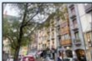
Erdigunea Ref. 195

Bikaina. Bista irekiak. Eguzkitsua. 235.000€