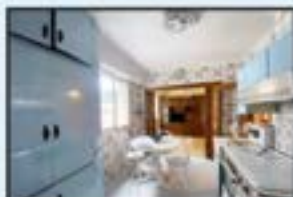
Legarre Gain Ref. 157