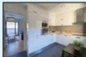
VPO-ko etxebizitza Ref. 246

3 logela. Trasteroa. Iggailua 0 kotan. 129.000€