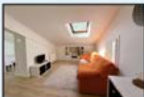
Erdigunea Ref. 210

Bikaina. Etxebizitza zabala eta eguzkitsua. Kontsultatu