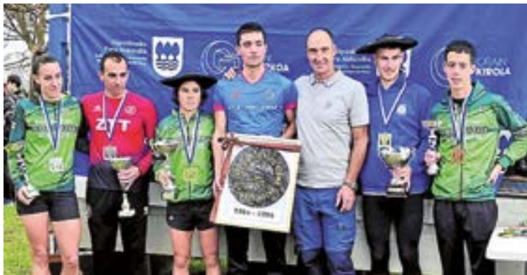
Irabazleak eta antolatzaileak, proben amaieran banatu ziren sariekin.