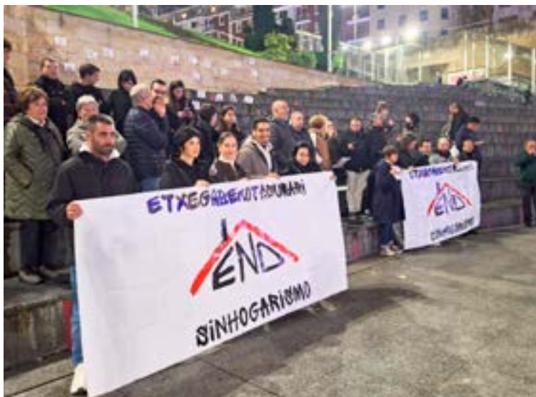
Aurreko hilean egindako Udalbatzera joan aurretik, Untzagan elkarretaratzera egin zuten.