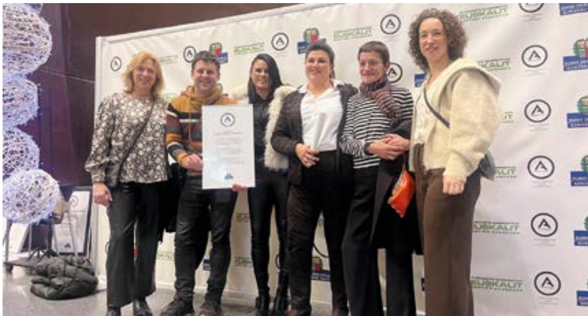
...eta kitto! Euskara Elkarteko kideak Euskalduna Jauregian egon ziren eguaztenean Kudeaketa Aurreratuari Diploma jasotzen. Kudeaketa Aurreratuaren Euskal Sariaren Ekitaldian brontzezko, zilarrezko eta urrezko sari nagusiez gain, aurten EAEko 54 erakundek jaso dute Euskaliten diploma.

grama planteatu genuen, azkeneko urtean kanpo kontrastea jaso eta, baldintzak betez gero, Kudeaketa Aurreratuaren Diploma lortzeko asmoz, gure Kudeaketa Aurreratuaren Euskal Sariaren eskemako lehenengo urratsa alegia.