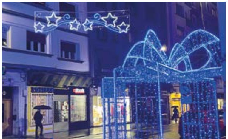
Gabonetako argiek herriko kaleak girotzen dituzte egunotan.

>>> Gabonetako plater nagusia hilaren 24an iritsiko den arren, asteburu honetatik aurrera hainbat ekintza egingo dira