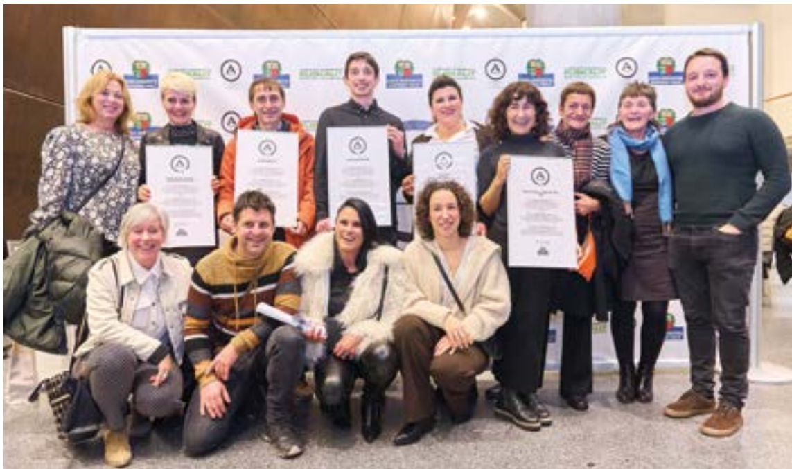
...eta kitto!-rekin batera beste lau hedabide/erakunde eskuratu dute diploma: Udako Euskal Unibertsitatea (UEU), Irutxulo Hitza, Aiurri eta Aiaraldea.

>>> "Guztira hiru lurraldeetako 31 hedabidek parte hartu dute; tokiko hedabide gehienak gipuzkoarrak izan dira"