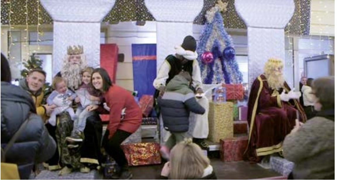
Erregeak izango dira protagonista urtarrilaren 5ean.

izango da. Lehiaketaren helburua Instagram eta Facebook bidez Gabonetan (abenduaren 31ra arte), Eibarko kaleak eta Gabonetako argiak atzean ageri diren selfien irudiak zabaltzea eta hedatzea da. Irudi edo selfie horiek #gabonakei-barren traolarekin Instagramen edo Facebooken argitaratu behar dira, eta @eibarkoudala aipatu behar da. Ekimen horrekin, halaber, herria bera dinamizatu nahi da, eta haren gaitasun komertziala eta zerbitzu-arlokoa indartu.