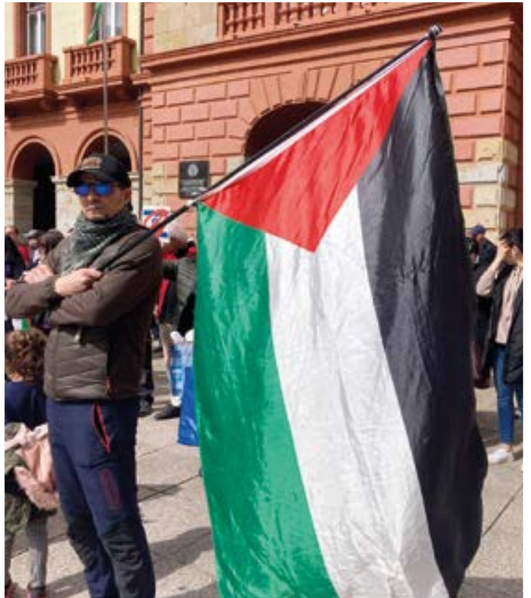
Palestinaren aldeko hainbat ekintza egin dira aurten herrian.

“Hitzetara eramaten ditudan egoera, eszena, elkarrizketa guztiak benetan gertatuko balira bezala irudikatzen ditut”