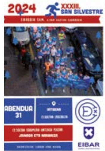
Aurtengo ediziorako kartela.

Orain dela bi urte hasitakoari jarraituz, San Silvestre proba gero eta herrikoago bihurtu da, jendearen parte-hartzea ere handituz: aurrez arratsaldetan Aixolako urtegiaren bueltan egiten zena orain bazkaldu aurretiko ohitura bihurtu dugu. Gose pixka bat egiteko, gainera, zer hobeagorik dantzan egitea baino? Horregatik, hasi eta ordu erdi geroago erromeria izango dugu