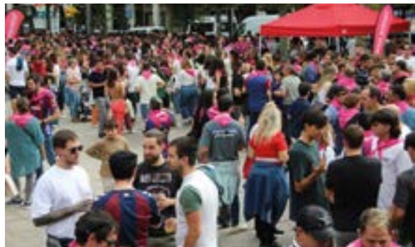
...eta kitto! Jaiak euskara eraman zuen plazara.