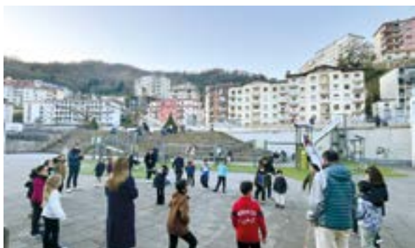
Barixakuak Jolasian-eko jolasak Torrekuan.