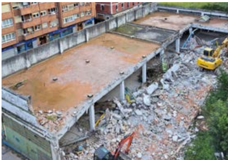
Gabilondo enpresaren eraikina botatzen hasi ziren udan.

“Etorkinei buruz ditugun aurreiritzi asko alde batera utzi behar ditugu euskaldunok”