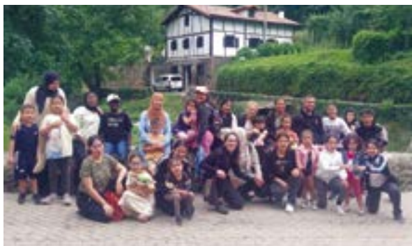
Ongietorriko familiak Leintz Gatzagan izan ziren.