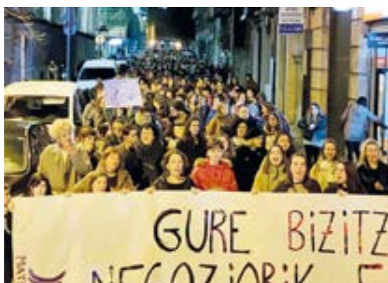
Martxoaren 8an, Emakumeen Nazioarteko Egunean, manifestazioa egin zen herrian.