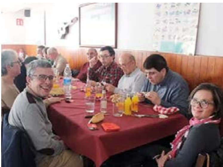
Gureak-eko langileak berriz ere elkartu ziren Urkizuko elkarte gastronomikoetan ohiko Erregeetako bazkaria egiteko.

“Oso pozik nago filosofia kalean egiteko aukerarekin, filosofia bertan egon behar da-eta”