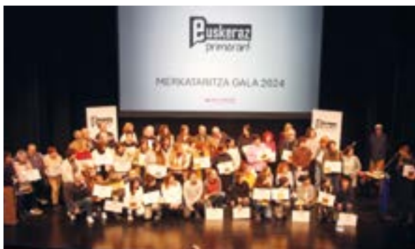
Euskararen inguruan egindako ahalegina aitortu zitzaizen merkatariei.