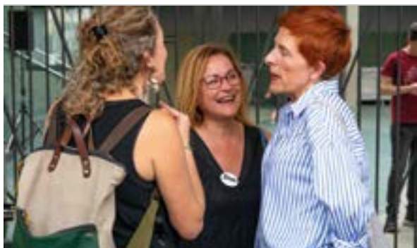
Berbalagunei aitortza egin zien ...eta kitto!-k.