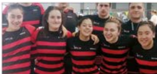
Eibar Igerixaneko Junior Nesken Taldea IGERIKETA