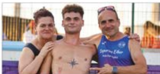
Atletismoko Egidazu/De Diego Lantaldea SARI BEREZIA

abenduak 31 / martitzena 12:00 / Coliseo Antzokia