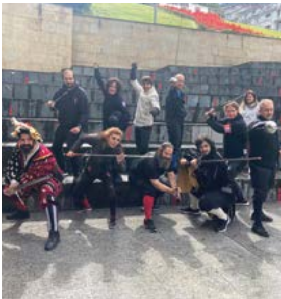
Eskrima klasikoaren ikuskizuna eman zuten Untzagan.

Irailarekin Arrateko Amaren Jaiak datoz. Aurten zapatuan ospatu zen egun nagusia eta, eguraldiak asko lagundu ez bazuen ere, milaka lagun elkartu ziren Arrateko zelaian. Bezperan ere demaseko giroa bizi izan zen, barixakua izanik ohikoa baino egita-