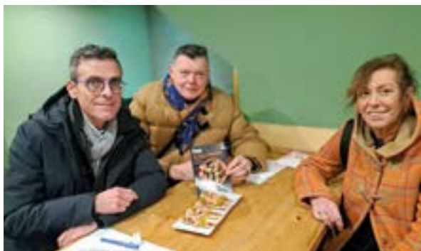
IX. Gilda Lehiaketan 15 taberna aritu dira nor baino nor.

Ongietorrikoek ogia eta gailetak egin zituzten Sosolan