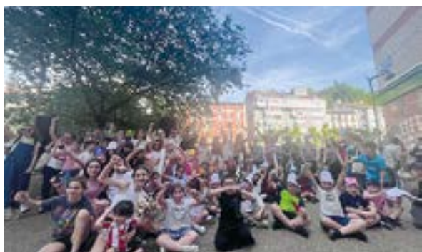
Familien arteko "Altxorraren bila" ekimenaren 3. edizioa.