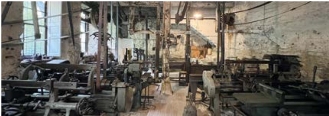
Zamacola lantegi-etxea bertatik bertara ezagutzeko aukera izan genuen.