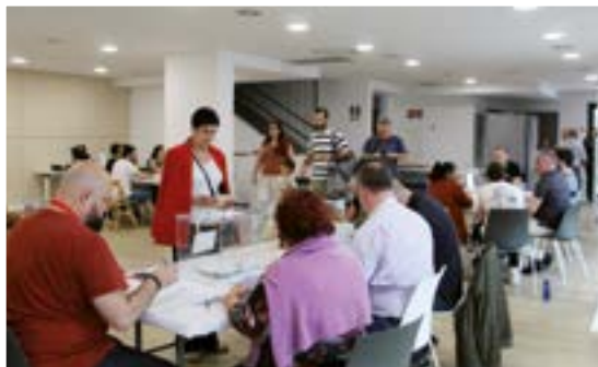
Aurten birritan joan gara botoa ematera. Lehena, apirilean, Eusko Legebiltzarrerako ordezkariak aukeratzera.

» 500 arbola landatu zituzten Zuhaitz Egunean.