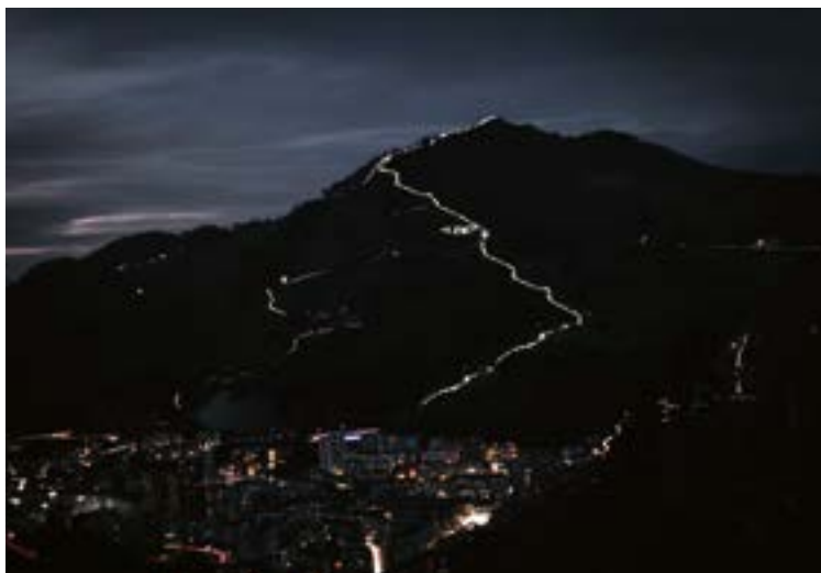
Urkorainoko bidea argiztatu zuten Eibarko Klub Deportiboren mendeurrena ospatzeko. IRAIA AGIRRE

“Komikiari asko falta zaio merezi duen tokia jasotzeko”