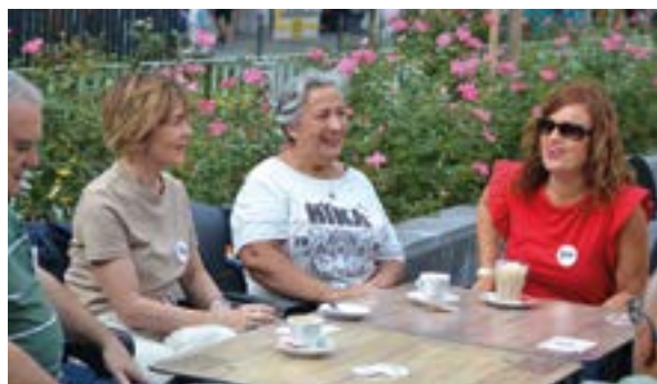
Berbalagunak mintzapraktika egiten.