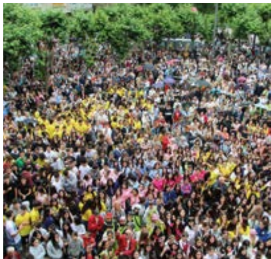
Jaiak eztanda egin zuen hilaren 23an.