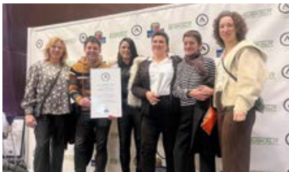
Kudeaketa Aurreratuaren Diploma jasotzen euskara elkarteko kideak.