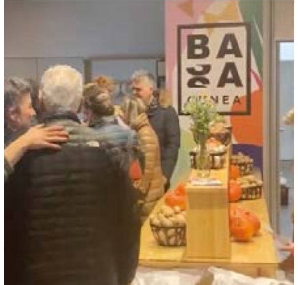
Basagunea aurkeztu zuten Errebal Plazan duen egoitzan.