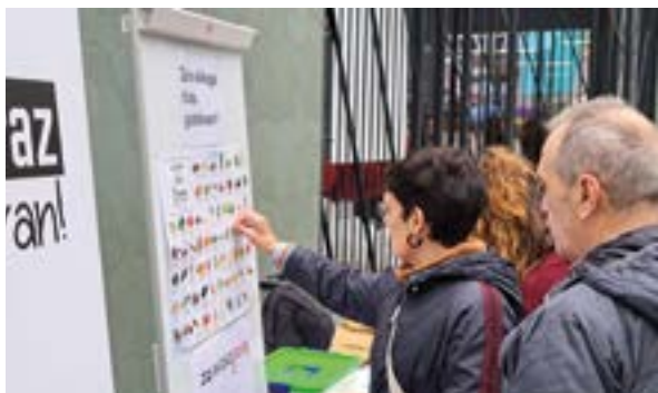
Euskeraz Primeran! neguko merkealdien azokan.

Datozen orriotan ...eta kitto! Euskara Elkarteak amaitzear dagoen 2024an egin dituen jardueren erakusketa txiki bat duzue, urtarriletik hasita abendura arte, hilez hile antolatu ditugunen laburpena. Eibartarron egunerokotasunean presente egon nahi izan dugu, euskaraz jarduteko aukerak eta espazioak emanez eta euskarari arnasmuneak eskainiz. Euskaldunei zein euskarara hurbildu nahi dutenei topalekua eskaini diegu gurean eta herriko eragile sozialekin egiten dihardugun elkarlanak ez du etenik izan. Guztion artean Eibar euskaldunagoa egingo dugu.