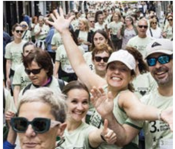
Minbiziaren aurkako martxan ehundaka lagun irten ziren kalera.