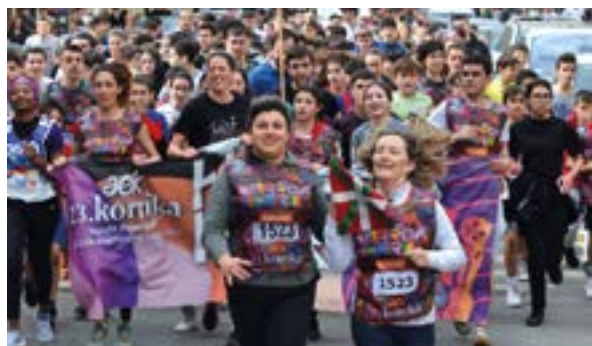
Korrikaren lekukoa harrotasunez esku artean.

Barixakuak Jolasian jolasak herriko auzoetan