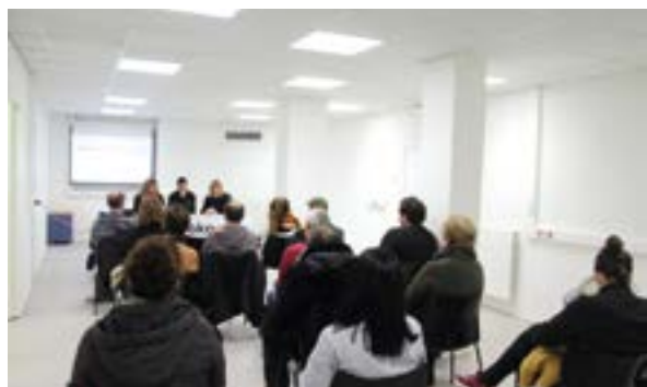
...eta kitto! Euskara Elkartearen Urteko Batzar Nagusia.