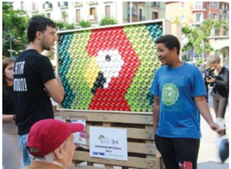
Birziklatutako latekin egindako horma-irudiak Untzagan erakutsi zituzten.

“XX. mendeko gertaerak epaitzerakoan orduko testuingurua izan behar da kontuan, oraingo gizartea desberdina baita”