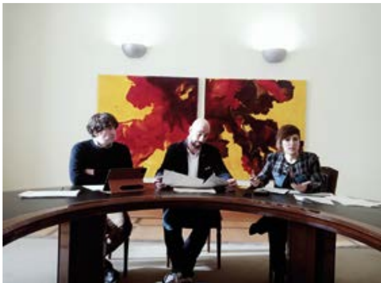
EAJ-PNV eta PSE-EE alderdien arteko hitzarmenak elkartana errezutuko diela uste dute.