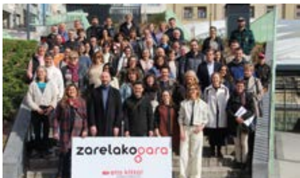
Zarelako Gara gizarteratze-kanpainaren aurkezpena.