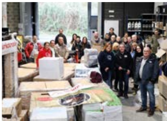
Zaporeak erronkak eratzun bikaina jaso zuen herritarren aldetik.