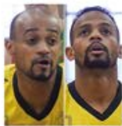
Polanco anaiak SASKIBALOIA