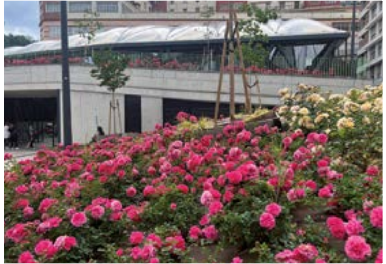
Udaberri kolorea hartu zuten herriko lorategiek.

“Urtero antolatu behar dugu Kulturartekotasun Jaia? Edo Sanjuanetan kulturartekotasun ekintzak txertatzeko ordua da?”