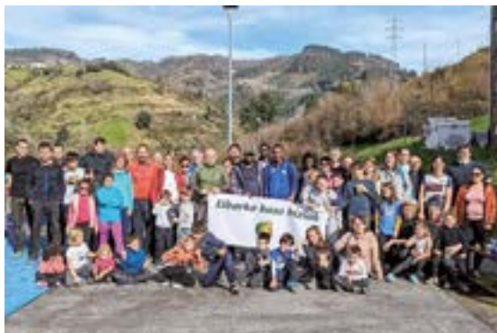
Eibarko Baso Biziak elkarteok ehundaka zuhaitz landatu dituzte urte guztian zehar Eibar inguruko mendietan.

Eibarko Baso Biziak elkarteak ekintzaz beteriko urtea eduki du eta, milaka zuhaitz landatzeaz gain, lur-sailak ere bereganatu ditu. Adibidez, urtarrilaren amaieran Haritzbakarragan 200 zuhaitz landatu zituzten.