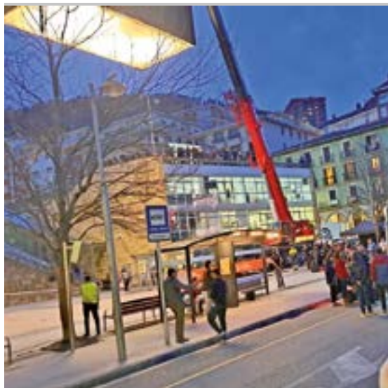
‘Cuerpo escombros’ pelikula filmatzen ibili ziren Untzagan.

Mugi Panderoa erromeria taldeak 10 urte bete ditu aurten eta martxa betean daudela erakutsi dute, gelditu barik ibili direlako.