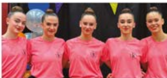
Ipuruako Oinarri Jubenil Taldea GIMNASIA ERRITMIKOA