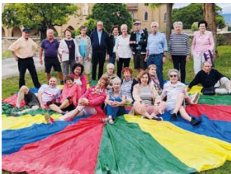
Jubilatuak San Asension egon ziren udalekuez gozaten.

“Eibar Rugby Taldearen aurka jokatu nuenean sentimendu kontrajarriak izan nituen”