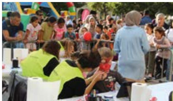
Berbetan jaialdiak eman zion hasiera ikasturtzeari.