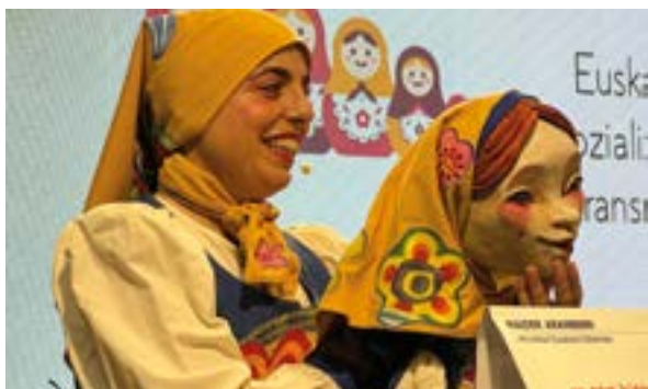
Euskararen sozializazioari eta transmisioari buruzko XIV. Mintegia.