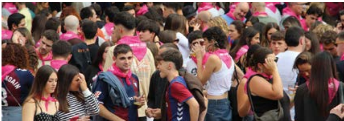
Milaka lagun elkartu ziren ...eta kitto! Jaian.

Musikaz gain, gorputza astintzeko aukera ere egon zen, Zumbatoia egin baitzen hileko azken asteburuan.