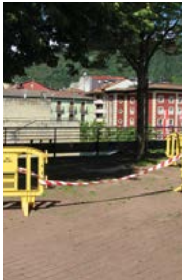
Herriko hainbat kaletan egin beharreko obra txikiak aurreikusi duten aurrekontua 640.000 eurokoa da.

Azpimarratu zutenez, “zalan-tzarik gabe, ekitaldi garrantzitsua izango da Barrena kalea berronertzea eta biziberritzearena. Izan ere, Estaziño eta Azitain lotuko dituen pasealeku-proiektuak aurrera egiten jarraitzeaz gain, eta beharrezko eraispenak egin ondoren, Hijos de Gabilondo fabrika zaharrean udal-ekipamendu be-