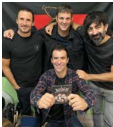
Judash taldeak bere lehen diskoa atera zuen.

“Barrutik ateratzen zaidana egiten dut, pentsatu gabe”