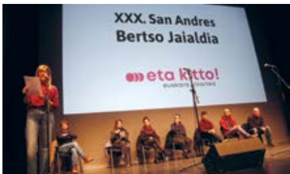
San Andres Bertso Jaialdiak puntako sei bertsolari ekarri zituen.