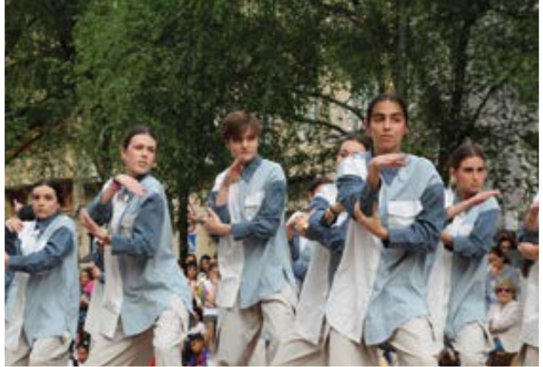
Herriko dantzariak hainbat erakustaldi egin zituzten kalean Dantzaren Egunean.

“Guatemalako Bake Ituna 1996an sinatu zen, baina estatu-biolentzia jasaten duen herrialdea izaten jarraitzen dugu”