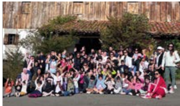
Gurusoak Berbetan eta Ongietorriko familiak Pagoetan.

Hizkuntza- eskubideen aurkako erasoaren salaketa