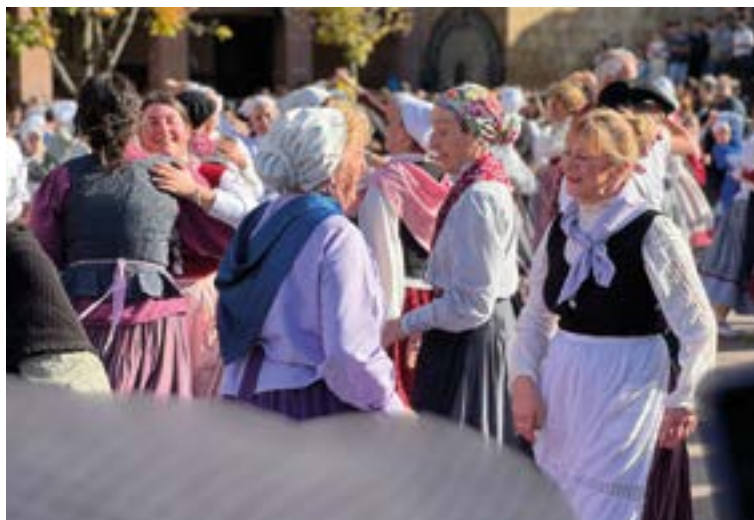
Eguraldi zoragarria izan genuen San Andres jaiaz gozatzeko.

"Behobia-Donostia ez dut modu konpetitiboan hartzen, festa moduan baizik"