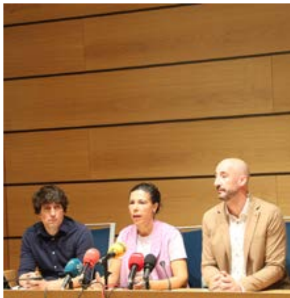
PSE-EEk eta EAJ-PNVk udal-akordioa hitzartu zuten.