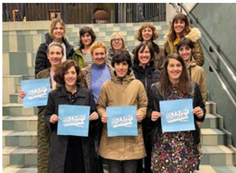
Haur eta nerabeek telefono mugikorrekina duten harremanaz arduratuta, Altxau Burua elkarteak sortu zuten herriko hainbat gurasok.

"Garrantzitsua da baserria eta abeltzaintza martxan egotea, eta herriarentzat elikadura bertatik sortzea"