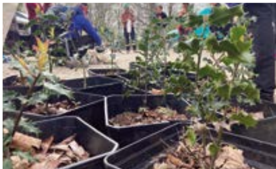
Herritarrek bikain erantzun zuten Zuhaitz Egunean.

Apirilaren 21ean Eusko Legebiltzarrerako hauteskundeak egin ziren. Eibarko emaitzei begiratuz gero, EH Bilduk 4.145 boto jaso zituen, orain arte horrelakoetan EAJ-PNV (3.806 boto) nagusi izan denari aurrea hartuz. PSE-EEk 2.948 boto lortu zituen.