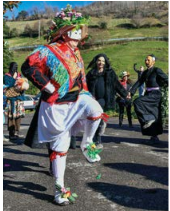
Koko Dantzak goiz iritsi ziren aurten herriko baserrietara, otsailaren hasieran. FERNANDO RETOLAZA