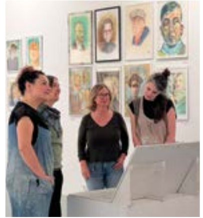
Ikasturte amaierako erakusketa egin zuten Zeramika eta Margo Eskolako ikasleek.

“Benetan mugitzen gaituena eszenatoki batera igo eta hor sortzen den energia bizitzea da”