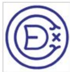
Eibarko Klub Deportiboa ERREKONozIMENDUA