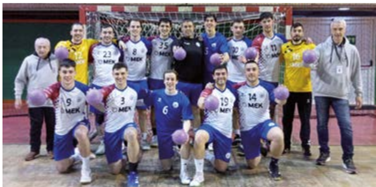
Igoerako promozio fasean sartzeko asmoak ez dituzte galdu Mek Eibar Eskubaloioek.