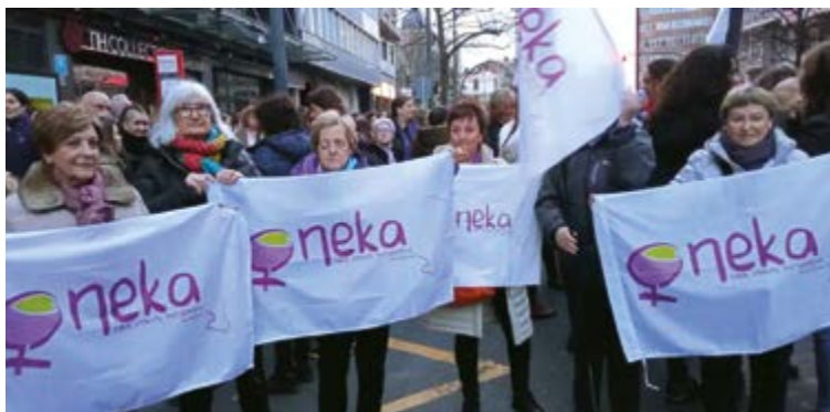
Euskal Herriko hainbat herritan jarduten du Onekak.

Pagatxaren eskutik. Saioa 18:30ean hasiko da eta 'Ellas hablan' pelikula ikusiko dute eta izango dute mintzagai.