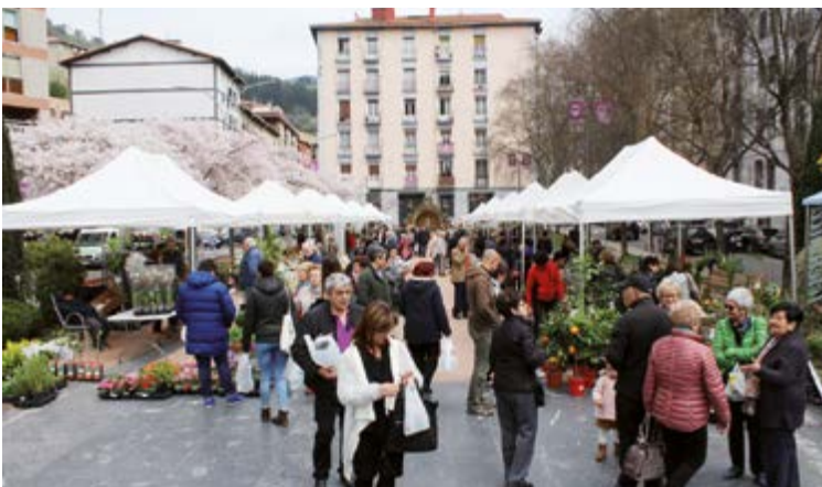
Urkizuko Azokan izango da zer eskuratu ekoizleek eskainitako produktu ugariaren artean.

Naturara gerturatzeko interes handiko ekimen biak egun berean koinziditzea pena izan daiteke, bata zein bestea lotzeko aukerarik egon badago ere. Aurreko urteotan Azoka zapatuetan egin izan bada ere, zuhaitz landatzearena gehienetan domeketan egin izan da gurean. Modu batean zein bestean, nongo zuhaitza besarkatu, hor egon daiteke zalantza bakarra. Dena dela, on egin, goiz-eguerdi ezin osasuntsuagoa bizitzeko aukera dugu eta!