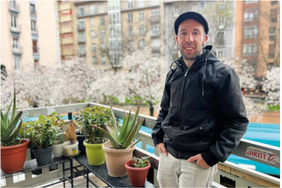
Ipuuako Merkatu Plazak eguenero hartuko du clown ikastaroa maiatzera arte. EKHIBELAR

ez naiz, amateurra naiz. Kontua da jendeak clowna ezagutzea eta gero bakoitzak nahi duen bidea hartzea. Uste dut aukera polita dela clownean hasteko eta zeren inguruan egiten den ezagutzeko.