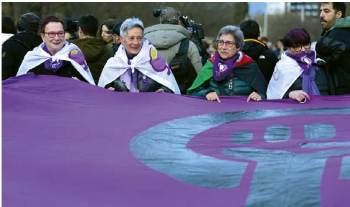
2018az geroztik jo eta ke lanean dihardu Oneka euskal emakume pentsionisten elkarteak.

Azken gai horri helduta, Onekak euskarri integral gisa ulertzen du zaintza, ez euskarri fisiko soil gisa (hau da, elikagaia, higiena eta mugikortasuna jasotzea). “Zoritxarrez, adinekoen zainketak, gehienetan, honetan laburbiltzen dira: gabezia fisikoak asetzeaz, gaitasunak eta pertsona egiten gaituen guztia ahazturik”, diote. Horregatik, zaintza-eredu egoki baten alde egiten dute.