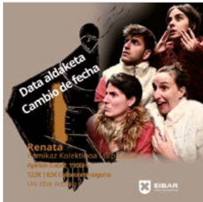
Azken orduan kaleratutako data-aldaketa.

Konpainiaren eta Udalaren arteko gaizki ulertu bat dela eta, martxoaren 16rako aurreikusia genuen "Renata" antzezlana dataz aldatu behar izan dugu. "Renata" antzezlanean funtzioaren data berria apirilaren 6a da, arratsaldeko 7etan hasita Uni-Eibar Antzokian . Funtzio data berri honetara joateko erositateko tiket guztiak aldatu behar ditugu (Coliseoko leihatilan antzokiaren ohiko salmenta-ordutegian, astelehenetan eta ostiraletan, 17:30etik 19:30era, eta funtzio-egunetan). Martxoaren 16rako sarrerek ez dute apirilaren 6rako balio. Data-aldaketa honetarako sarrera erosi duen norbaiti etortzea ezinezkoa egingo balitzaio, dirua itzultzeko kanalen informazioa datorren astean zabalduko da (943 708 435 telefono zenbakia).