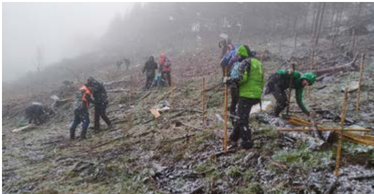
Basoak Bizirik-ek iaz antolatutako landaketan eguraldiak ez zuen larregi lagundu.

>>> 14 espezie autoktonotako 350 zuhaitz eta zuhaixka landatuko dira Pagaegikortako lursailean