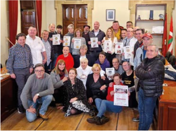
Aurreko astean aurkeztu zuten Zaporeak proiektuaren erronka solidarioa sukaldari eta boluntarioek, eskualdeko agintariek batera, Ermuko udaletxean egindako agerraldian.