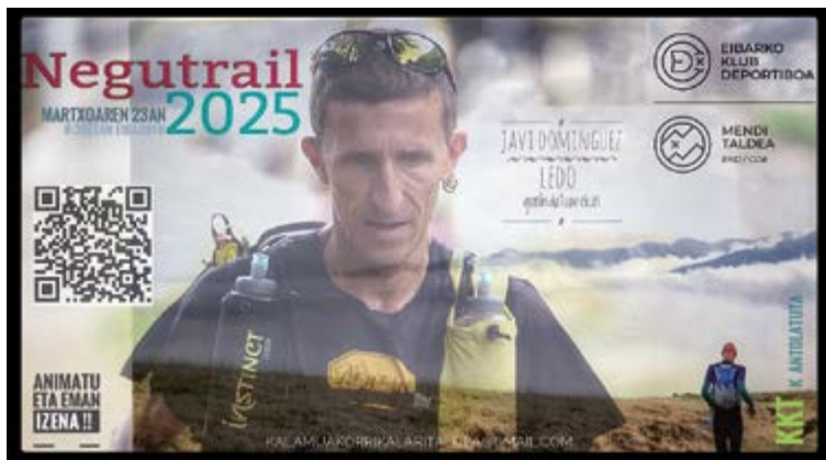
Aurtengo edizioko kartela. Parte-hartzea doan bada ere, QR horretan eman behar da izena.

Goizeko 08:30ean abiatuko dira Klub Deportiboaren egoitzaren aurretik eta, badaezpada, antolaztaileek bi ibilbide prestatu dituzte, "eguraldiaren eta mendiaren baldintzen arabera". Ibilbide bietako hasiera eta amaiera berdina izango dira, baina A ibilbidean Urkora igoko duten bezala, B ibilbidean Urko azpitik pasatuko dira. Zailtasun mailari dagokionez, erraza dela diote, eta A ibilbideak 13 kilometro eta erdi izango ditu eta B ibilbideak ia