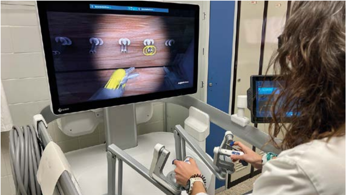
Ebakuntzak egiteko orduan hainbat abantaila eskaintzen ditu Hugo RAS-ek. EKHI BELAR

den bezala. Hau da, ez du inongo arazorik eragingo”, argitzen digu Agirreazaldegik.