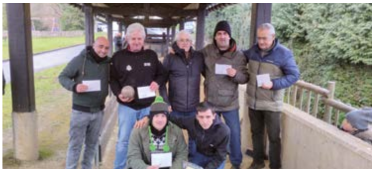
San Andres bolatokian saritutako seikotea, tartean Asola Berriko hiru ordezkariak.