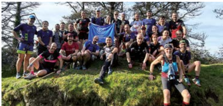
Iazko NeguTrailean parte hartu zuten gehienak talde-argazkian.

aldiz irabazi ditu, G2H (88 km) behin, Hiru Haundiak (100 km) beste bitan. Horrez gain, Gasteizko 10 mendiak (55 km) eta Tor des Géants (330 km) probetan ere nagusitu zen, azken horretan errekorra eginez. Ahaztu barik Europako mendi-taiko Travesera (75 km) eta Gran Trail Aneto Posets (106 km) probak ere bereganatu zituela, hirugarren izanik Ultra Trail du Mont Blanc (167 km), Grand Raid de la Reunión (167 km) eta Hardrock 100 Endurance (161 km) maila handikoetan. Negutrailean berarekin solasaldia izateko geldialdiak Santa Kurutzen (3'5 km), Usartzan (7 km) eta Arrajolan (12 km) egingo dituzte, une horiek galderak egiteko aprobetxatuz. Akondia tontorrean (5,5 km), bestalde, aterako dute talde-argazkia.