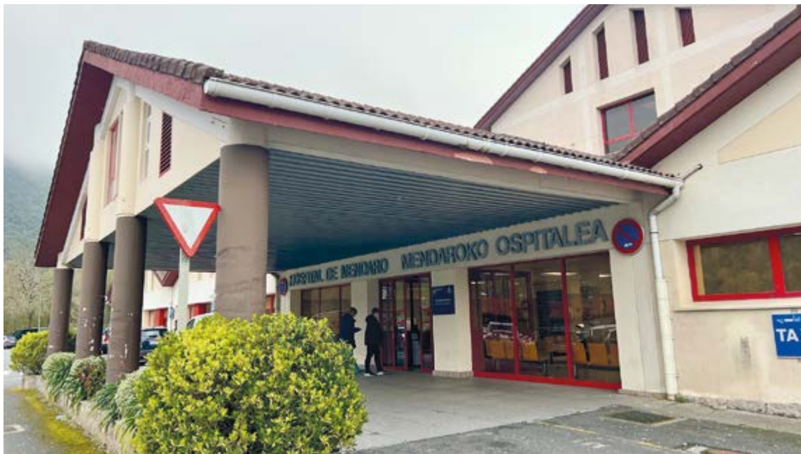
Horrelako robot bat eskualde-ospitale batean instalatzen den lehen aldia da. EKHI BELAR