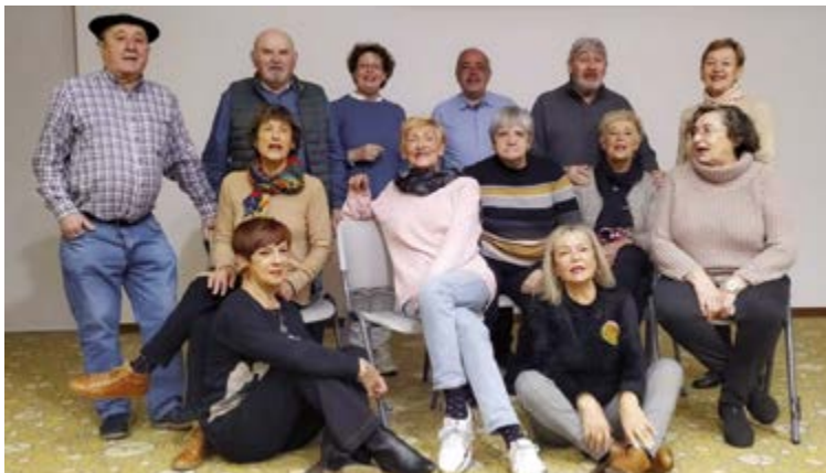
Badira hamar urtetik gora “La Novena”-koak oholtzara igotzen hasi zirela.

Oraingo hau ez da euren lehen lana (aurretik egin dituzte beste batzuk, tartean “Sonrisas y risas” azkenetarikoa) eta, esperientzia horretaz baliatuz, “pertsonaiekin jolas egin” nahi izan duten honetan, “bestelako istorio bat garatzen” dute, umorea erabiliz. Beste istorio horietan, askatasun bila dabilzan emakume batzuk gertakarien gurrupil zoro batean murgilduko dira, “Errege Katoliko, Kolon eta XV. mendeko beste pertsonaien bueltako bizitzetan oinarrituz”.