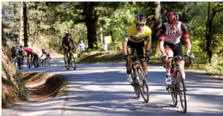
Roglic eta Pogacar aurreko edizio batean. Eurak gabe, edizio irekiagoa izango da aurtengoa.

Gure herriko OCETA antolakuntza taldeak prestatzen duen Itzulia Basque Countryk 64. edizioa biziko du datorren astean, astelehenean Gasteizen hasi eta zapatuan Eibar-ko T. Etxebarria kalean amaitzeko. Apirilaren 7tik 12ra jokatuiko den probak sei etapa izango ditu, beraz, honela banatuta: astelehenean Gasteiz-Gasteiz, 16 kilometro eta erdiko erlojupekoa; martitzenean Iruñea-Lodosa, luzeena, 200 kilometrokoa; eguaztenean Zarautz-Beasain, 156 kilometrokoa; eguenean Beasain-Markina-Xemein, 170 kilometrokoa eta gure inguruetan lehiatuiko dutena; barixakuan Urduña-Gernika-Lumo, 172 kilometro osatzeko; eta azkena, zapatukoa, Eibarren hasi eta amaituko dena, 154 kilometroko ibilbide neketsua osatu ondoren. Txirrindulariek, guztira, 865 kilometro egingo dituzte aipatutako sei egunotan; gorabeheratsuak eta gogorrek izango dira horietako asko, 27 mendatetara igoko baitira.