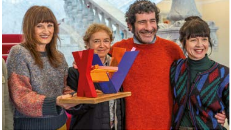
“Zorretan” lanak Donostia antzerki saria ere irabazi du dagoeneko.

Kontakizunean zehar egoera komikoak, absurduak edo surrealistikak gertatuko dira, pertsonaiaren iraganaren, orainaren edo etorkizunaren arteko narrazio hautsi batean.