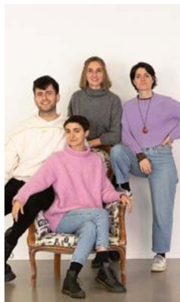
Kamikaz Kolektibokoek antzetzuko dute “Renata” domeka honetan Uni-Eibarren.