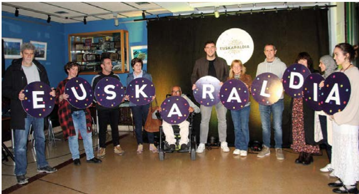
Otsailean aurkeztu zuten Eibarko Euskaraldiaren hamaikakoa. SILBIAHERNANDEZ