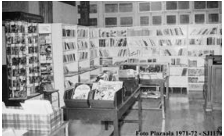
Goian, Eibarko tren geltokiko liburu-denda. Behean, Estaziño kaleko Ayerbe. PLAZAOLA

aukera dago; Egoaziarekin elkarlanean ‘Hezkuntza defendatu, Larraldia itzali’ lelopean kalitatezko hezkuntza inklusiboa eta bidezkoa bermatzeko ekimena jarri dute martxan; eta maiatzaren 14rako Giza Liburutegia ekimena antolatu dute Udaleko Immigrazio eta Kultura Aniztasun sailarekin batera.