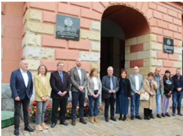
Errepublikaldarrikatu zen eguna gogoratzen duen plaka azpian lora-sortak laga eta talde-argazkia eginda agurtu zuten ekitaldi instituzionala. SILBIA HERNANDEZ