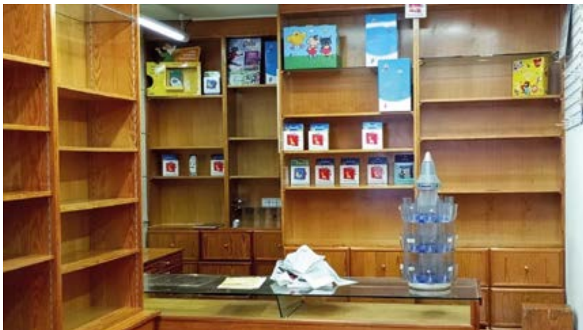
Yraolagoitia liburu-dendaren itxierak hutsune handia laga du herrian.

ruak edukitzen zituztelako”, kon-tatu digu Gutierrezek.