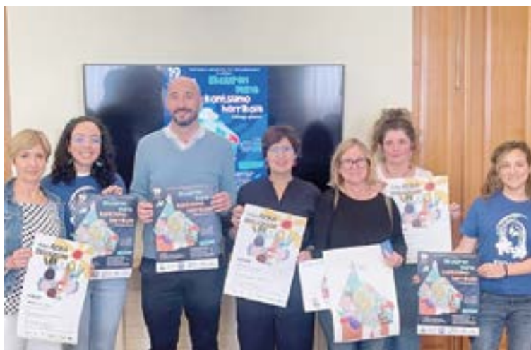
2025eko aurrekontuak 427.000 euro baino gehiago bideratzen ditu garapen-, sentsibilizazio- eta gazteen elkartasun-proiektuak laguntzera. ARTXIBOKO IRUDIA