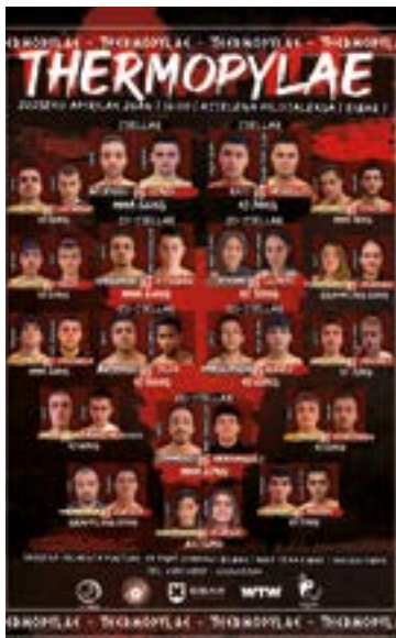
36 borrokalari bilduko ditu biharko jaialdiak. Aurretik, gaur bertan, pisaketa ekitaldia egingo dute Untzagan.