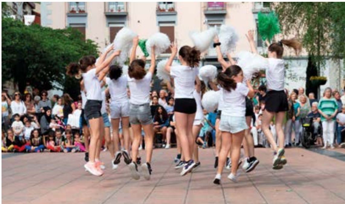
Dantzak herriko toki ezberdinetara eramango dituzte talde eta akademiek. EIBARKO UDALA