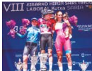
Txirrindulari ezagunei eta hasiberriei, gizonetako zein emakumezko izan, lasterketetan aritzeko aukera eman die Eibarko Txirrindulari Elkarteak.

Trueba...”, dio Aranberrik. Gainera, ez zen egun bakarrera mugatzen. “Hiru egunekoa ere izan zen. Egun batean San Juan Saria ospatzen zen, hurrengoan Abiadura Saria (San Andres elizatik, binaka, Agiñaspi taberna pareraino) eta hirugarrenean Eibarko Zirkuitua (herriari 25 buelta emanez)”, azaldu digu.