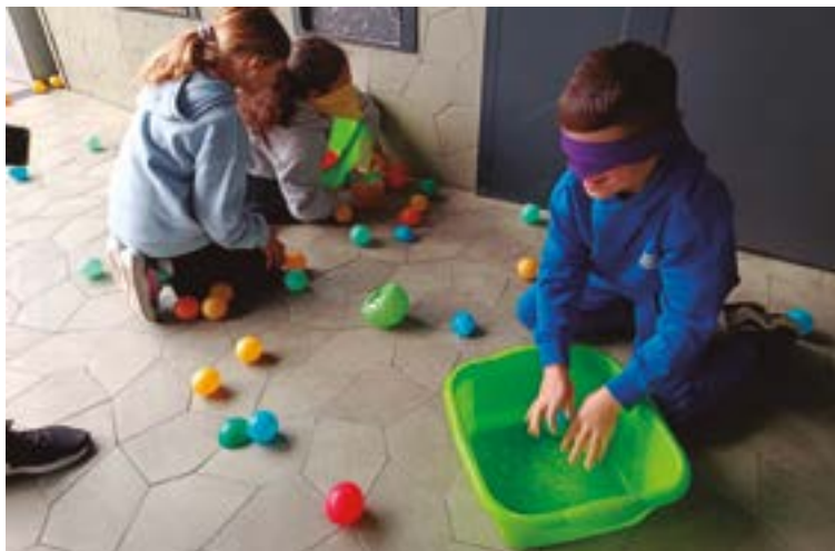
Kirol aniztasunak haurren garapen integrala sustatzen du, besteak beste. ESKOLA KIROLA