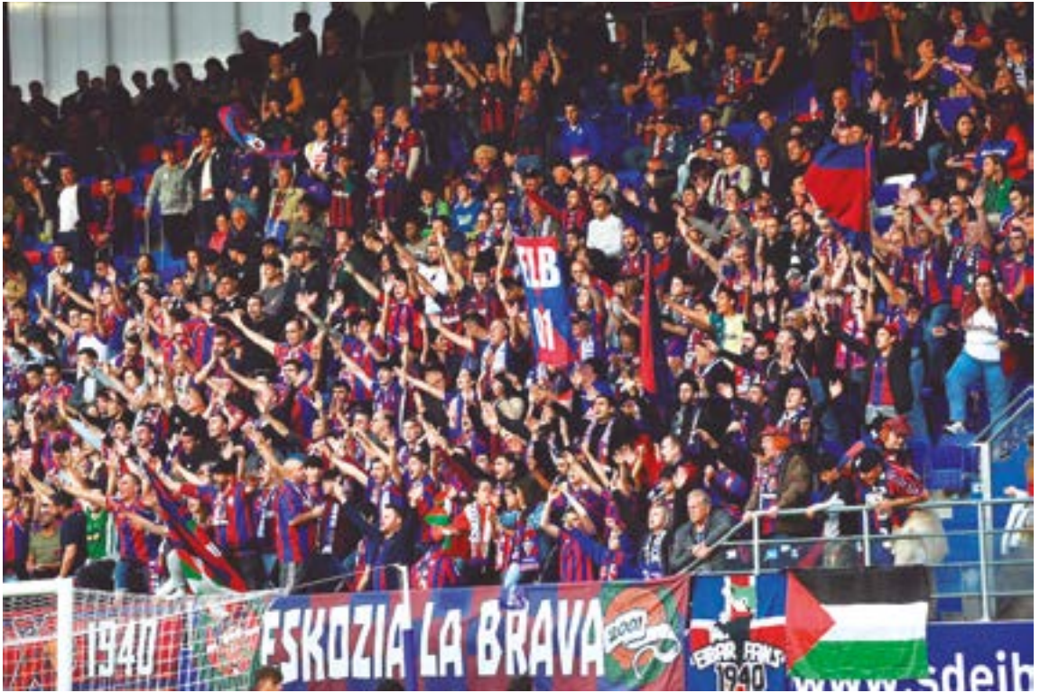
Ipuruako ekialdeko harmaila kolorez eta animo oihuez betetzen ditu Eskozia La Bravak.

taldea animatu eta Eibarren izena goian jarri.