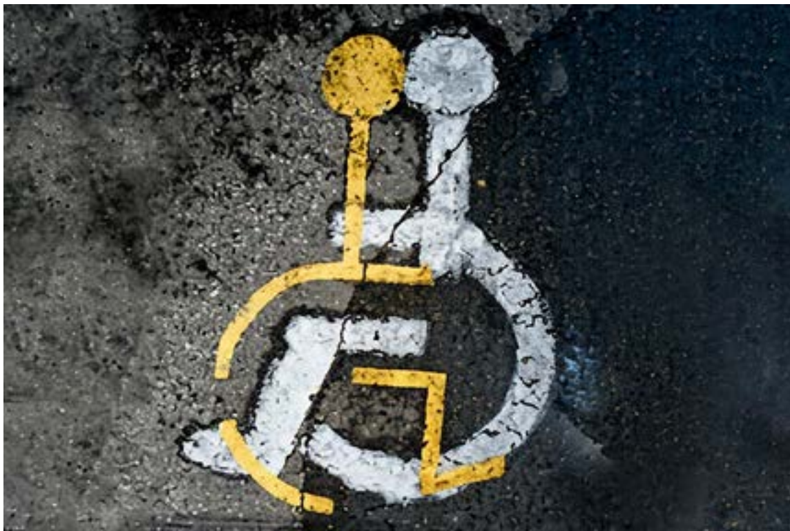
Aniztasun funtzionala duten pertsonengan baliabide eta tresna irisgarrien beharra defendatu du Loyk.