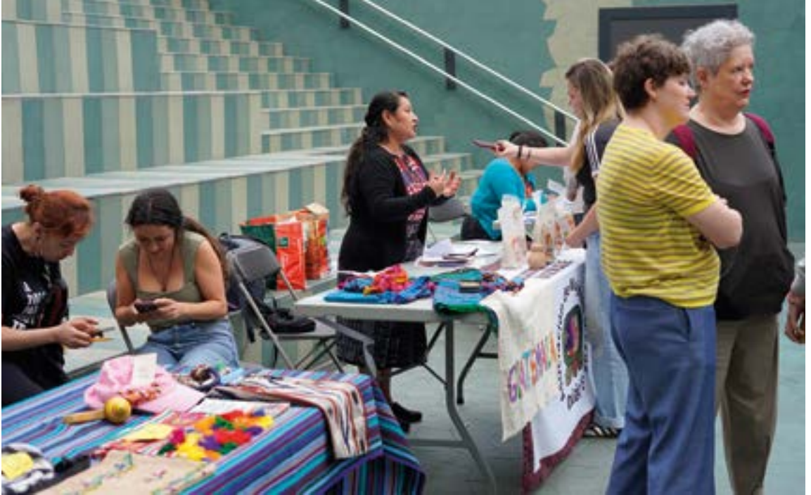
Guatemalako erakunde eta elkarteek haien jarduna azaltzen zuten postuak jarri zituzten Errebal Plazian. YANIRE SAGREDO

Talde motorraren izenean hitz egin zutenek azaldu zuten bost urteko ibilbidea etengabeko berrantolaketan dela: pertsonen etorrerak eta irteerak, erritmo desberdinak eta auto-hausnarketa prozesuak egituraren parte bihurtu direla.