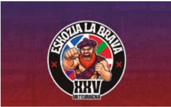
25 urte hauetan une gogoangarriak bizi izan ditu Eskozia La Brava etetik kanpo eta 25. urteurrenerako logo berria diseinatu du.