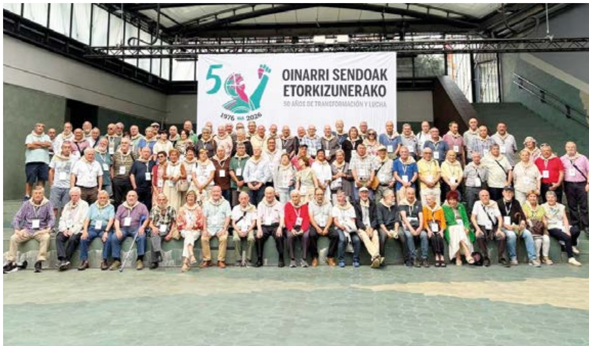
Eibarko Coliseo antzokiak hartu zuen omenaldira 1977tik gaur arte ELA sindikatuko afiliatuak diren 94 andra-gizon bertaratu ziren, eta oso eskertuta jaso zuten bildutako guztien aitortza.