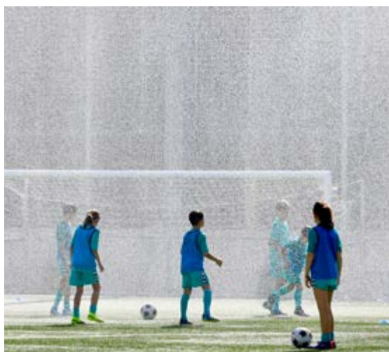
Goian, Eibar Eskubaloien udalekuak. EIBAR ESKUBALOIA Behean, SD Eibar-en Udako Kanpusa. SD EIBAR