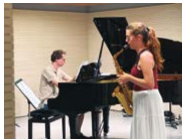
Aste osoan zehar Musika Eskolan egiten dituzte klaseak; kontzertu gehienak, ostera, Azitaingo parrobian. EKHI BELAR

saria irabazi zuen, Herbehereetako oso lehiaketa ospetsua. Gainera, saxofoiaren erreperitorioa oso ondo ezagutzen du. Luxuzko taldea da!”.