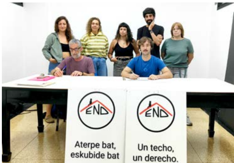
Azken hilabeteotan burutu duten sinadura-kanpainaren berri eman zuten END plataformako kideek, eta irailean Eibarko Udalbatzarrean eztabaidatzeko mozioa aurkeztuko du plataformak. SILBIA HERNANDEZ