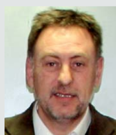
Iñaki Zuloaga (EAJ-PNV)