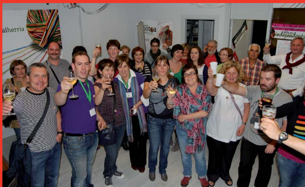
Hamabost egun besterik ez duen Bildu koalizio berriaren partaideek txanpainarekin ospatu zuten atzo herrian izandako emaitza, Toribio Etxebarriako lokal berrian.

Bildu, indartsu sartuta, bigarren alderdi bozkatuena izan da