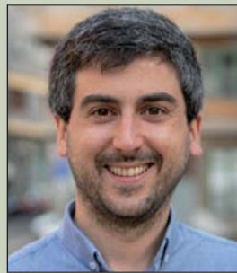
Josu Mendicute EAJ-PNV