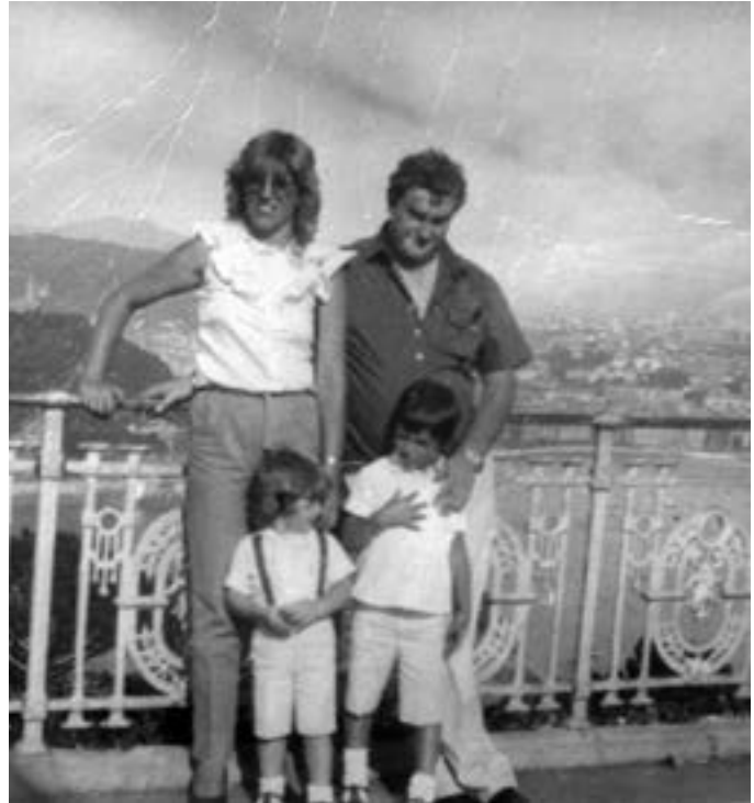
Donostian, senarrarekin eta bi semeekin.

kotxea izan genuenean. Ordura arte, autobu- sez joaten ginen. Untzagatik pilla bat autobus irteten ziren, Zamorara, Galiziara... 12 bat ordu behar izaten genituen Froufetik bi kilometrora dagoen herrira ailegatzeko. Gero, han, amama egoten zen gure zain, astoarekin, maletak era- mateko.