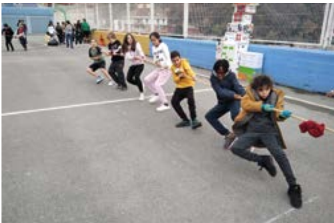
ARRATEKO ANDRA MARI