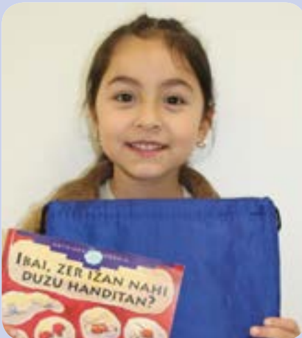
Sofia pozik bere sariekin.