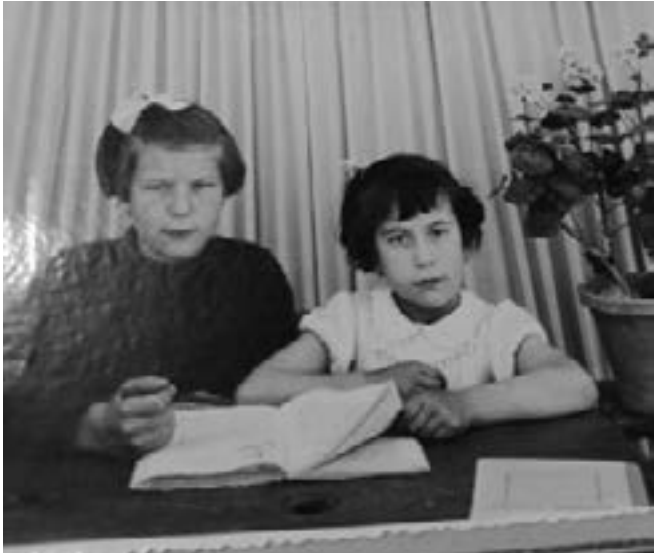
Flora eskuman ahizpa nagusiaren ondoan.