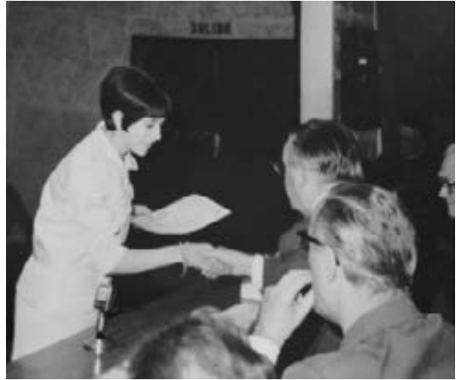
Graduatua jasotzen, Karmelitetan.